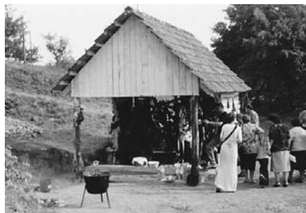
Sušiareň v Baďane

Priamo v Baďane je takmer dokončená tradičná drevená sušiareň ovocia. Jablká, dopestované miestnymi ľuďmi, ktoré nespotrebujú na pečenie alebo zaváranie, prípadne na prípravu jablčného muštu, budú môcť teraz sušiť a obohatiť tak svoju ponuku jablčných pochúťok počas mikroregionálnej akcie „Podsittianske dni hojnosti“. Základná stavba sušiarne je dokončená, zostáva vyhotoviť lesy – rošty z lieskových prútov, ktoré slúžia na samotné sušenie ovocia.