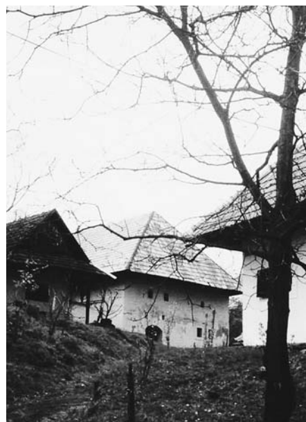
Pivničky v Sebechleboch

Ľudia z vybraných mikroregiónov mali možnosť zúčastniť sa workshopov, tréningov a výmenných štúdiijných ciest, v rámci ktorých sa mohli podeliť o svoje skúsenosti, získať technickú a odbornú pomoc a využiť praktické poznatky