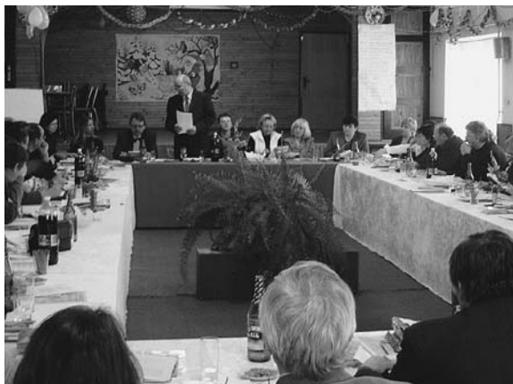
Členská schôdza OZ BB VIPA