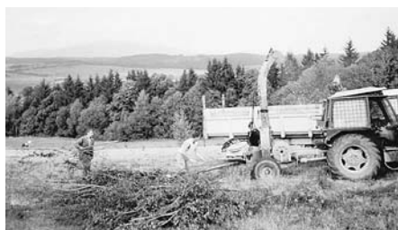
Spracovanie dreveného odpadu

mu Život na vidieku, ktorý na Slovensku manažovala Nadácia Ekopolis v rámci konzorcia EPCE, budú po spracovaní uvedené v najbližšom vydaní štvrťročníka.