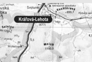
MR Ramža, obce: Bacúch, Nižná Boca, Vyšná Boca, Kráľova Lehota, Malužiná