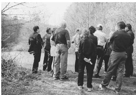
Na Morave v obci Modrá majú vďaka starostovi vybudovaný rybník