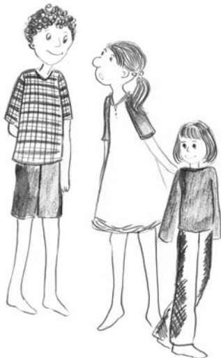
Voľnočasové aktivity, kde ste... kresba: Viktória Furová

Deti vo veku 10–15 rokov začínajú viac rozmyšľať o zmysluplných možnostiach trávenia voľného času, majú vyhranenejšie záujmy, začínajú sa aktívne zapájať do krúžkov, uvedomujú si účasť na spoločenskom živote. Dokážu spracovať a iným podať viac nových informácií. Rastie ich osobnostná kapacita. Na druhej strane sa veková hranica 10 rokov stáva „vstupnou bránou“ pre negatívne faktory, ako sú alkoholizmus, drogy, túlanie sa. Deti hľadajú autoritu a vzory. Táto skupina je veľmi tvárna a komunikatívna, preto platí, že včasná a preventívna práca je pomoc dvojnásobná.