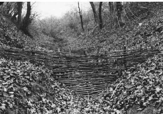
Na prehrádzkach sedimentuje unášaný materiál, čo bráni zanášaniam kanalizácie

Prehrádzky budujeme z miestneho materiálu a to najmä dreva alebo vrbových prútov. Pri využití oboch materiálov je potrebné vykopat do brehov suchej rokľe 30–50 cm hlbokú ryhu, do ktorej budú prečnievajúce konce materiálu „zapažené“ a následne zasypané a zhutnené výkopovým materiálom, aby sa zabránilo vytrhnutiu prehrádzky vodným prúdom.