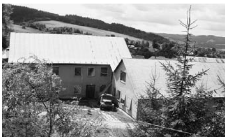
Projekt zateplenia podkrovných priestorov ZŠ v obci Rabča