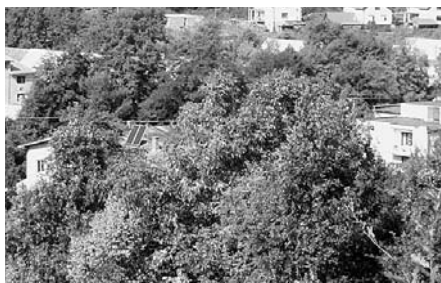
Slnečné kolektory v obci Prenčov

V maďarskej dedinke Gömöröszöllös, len niekoľko kilometrov od štátnych hraníc medzi Slovenskom a Maďarskom, sa účastníci študijnej cesty dozvedeli veľa podrobností a údajov, ktoré ich zaujímali a ktoré potrebovali pre vyhotovenie solárnych panelov. Hovorilo sa o funkcii a parametroch slnečných kolektorov, o podmienkach ich umiestnenia a využívania. Mali možnosť prehliadnúť si funkčný systém ohrevu teplej vody nainštalovaného v miestnom penzióne. Obyvatelia obce majú k dispozícii dieľňu s pomôckami, nástrojmi a zariadením, ktoré sú potrebné na svojpomocnú výrobu slnečných kolektorov.