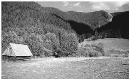
Tradičná lúčna maštal'

Zachovať typické bocké maštale bolo cieľom ďalšieho projektu, ktorý sa realizoval v Mikroregióne Ramža. Kým pred niekoľkými rokmi boli tieto drevené stavby bežnou súčasťou okolitých lúk a pasienkov, dnes je tomu inak. Niekoľko maštali je možné sice vidieť aj pri hlavnom cestnom ťahu z Čertovice smerom na Liptovský Hrádok, ale sú väčšinou vo veľmi zlom stave, mnohé z nich napoly rozpadnuté.