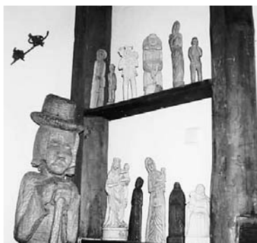
Interiér galérie

Turisti potrebujú nielen užitočné informácie, miesta na oddych a možnosť stravovať sa. Oblasť, ktorými prechádzajú, si zapamätajú aj podľa toho, kde videli niečo nevsedné, jedinečné. Takým miestom je určite aj Galéria na skale v obci Kráľova Lehota (MR Ramža). Na konci dediny nie je možné neprehliadnúť na modro natretý menší rodinný domček, okolo ktorého sa vinie plot zhotovený z lieskových prútov. Na dvore, z ktorého sa týči vysoká skala stoja prvé vystavené sochy galérie. (medveď v skutočnej veľkosti a socha znázorňujúca staršiu vidiečanku). Kto sa tým smerom vyberie, bude môcť obdivovať aj ďalšie sochárske diela Dalibora Novotného a iných umelcov dreva.