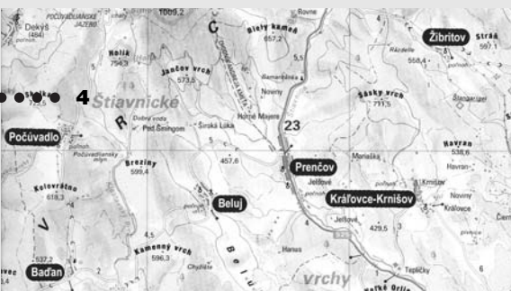
MR Južné Sitno, obce: Baďan, Beluž, Preňčov, Počúvadlo, Kráľovce-Krnišov, Žibritov