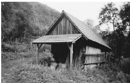
Storočná sušiareň v Šipkove (hore) a sušiareň v Trebichovej (dole)