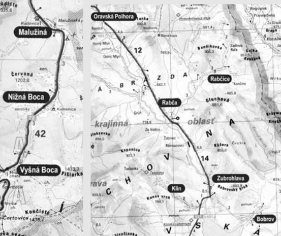
MR Babia hora, obce: Bobrov, Klin, Zubrohľava, Rabča, Rabčice, Oravská Polhora