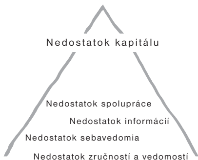
Trojuholník komunitných problémov