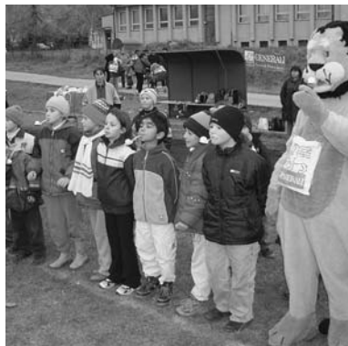
Deti z Horehronia dali rozlet svojej šikovnosti počas Šarkaniády v Polomke