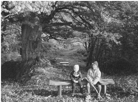
Pod starým bukom, ktorého vek odhadli ochranári na 300 rokov

drevených lavíc, prikryl sa prameň pitnej vody. Nadšenci prírody tu môžu načerpať dostatok energie na pokračovanie smerom k rozhľadni, ktorá je postavená v najvyššom bode trasy chodníka s prekrásnym výhľadom na južné svahy mikroregiónu. Informačné tabule, ktoré budú osadené na jar 2004 vás nielen bezpečne usmernia, ale vám zároveň poskytnú informácie o miestnych zaujímavostiach.