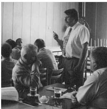
Dlhodobý cieľ projektu Zvýšenie účasti verejnosti je zlepšenie absorpčnej schopnosti vidieka

Cieľ. skupinou projektu pre cieľ 1 sú starostovia miestnych samospráv. Oni sú najdôležitejšou hybnou silou života v obciach. Od nich vychádza väčšina rozvojových aktivít obcí aj s dopadom na širšie okolie. Prax ukazuje, že od postoja starostov závisí intenzita a kvalita spolupráce samosprávy s predstaviteľmi podnikateľov a občianskeho sektora, ako aj s okolitými obcami. Cieľovou skupinou projektu pre ciele 2 a 3 sú súčasne jestvujúce vidiecke združenia. Z 37 mikroreg. združení v kraji je 34 orientovaných na rozvoj vidieka a 7 z nich je registrovaných na MV SR a čiastočne spĺňa podmienku verejno-súkromného partnerstva. V súčasnosti je v rámci 34 vidieckych mikroregiónov združených 288 samospráv, ktorých starostovia a poslanci tvoria cieľovú skupinu pre cieľ 2. Cieľová skupina projektu pre cieľ 3 sa rozšírila aj o zástupcov MVO pôsobiacich v obciach a o zástupcov miestnych podnikateľov.