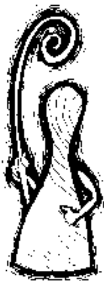
Kariérny šaman kresba: šomo

nám postupom času podarí presadiť túto systémovú zmenu, ktorá by bola viac ako vítaná, vzhľadom k tomu, že vidieku sa nevenuje na národnej úrovni dostatočná pozornosť. Systémové zmeny, ktoré sa chystajú na úrovni úradov práce by v pozitívnom zmysle mohli prispieť aj na cieľenejšie využívanie opatrení Aktívnej politiky trhu práce, kde je priestor na využitie kariérnych poradcov na vidieku, práve v poskytovaní služieb zamestnanosti.