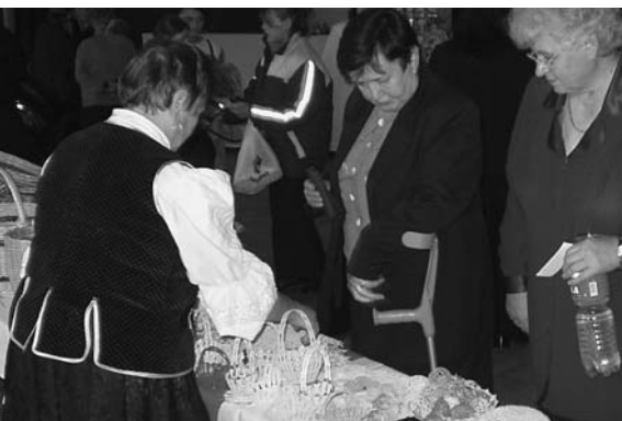
Všetci prítomní dostali na pamiatku perníkové srdiečka