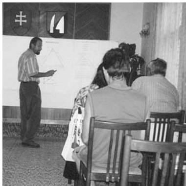
Starostovia sú najdôležitejšou hybnou silou života v obciach

Dohodli sme sa, že podujatia budeme organizovať jednak po regiónoch a jednak po cieľových skupinách. Zorganizovanie úvodných vstupných informačných seminárov prevzala na seba ÚBBSK. Od konca januára do polovice februára sa uskutočnili vstupné informačné semináre pre všetky cieľové skupiny a dôležitých aktérov v štyroch regiónoch – Horehronskom, Stredohronskom, Novohradskom a Gemerskom. Celkovo sa na týchto podujatiach zúčastnilo 389 účastníkov. Súbežne sa uskutočnili pre všetky jestvujúce mikroregióny aj semináre zamerané na rozšírenie informácií a skúseností o výsledkoch projektu Podpora regionálneho rozvoja, ktorý bol realizovaný v roku 2002 v Banskobystrickom kraji za podpory Britskej vlády. Tieto semináre organizoval ENTERPLAN v spolupráci s BB VIPA a ich cieľom bolo oboznámiť mikroregionálne združenia o dosiahnutých výsledkoch a o metodike spracovávaní programov sociálneho, ekonomického a kultúrneho rozvoja mikroregiónov. Účastníci obdržali metodické príručky vydané ENTERPLANOM. Celkovo sa na štyroch regionálnych diseminačných seminároch zúčastnilo 113 zástupcov mikroregiónov. Vo februári BB VIPA zorganizovala jeden informačný seminár pre vidiecke iniciatívy, ktorého sa zúčastnilo 45 zástupcov rôznych organizácií pôsobiacich na vidieku