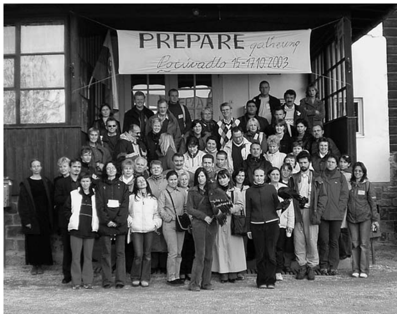
Spoločná fotografia účastníkov po rozlúčke.