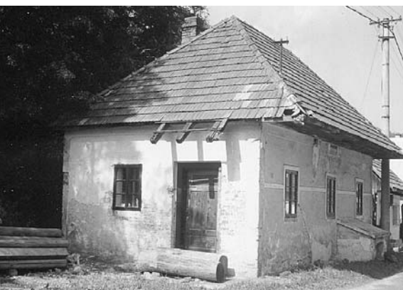
Dalova galéria na skale

Pán Dalibor Novotný sa venuje drevorezbe už dlhé roky. Po presťahovaní sa na Liptov chcel pokračovať v aktivitách v tejto oblasti. Našiel vhodný objekt, ktorý postupne