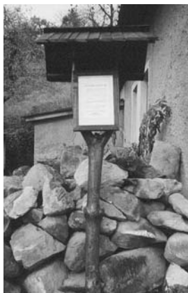
Náučný chodník na Skalku

niekedy s pomocou 2–3 miestnych dobrovoľníkov, sa im podarilo na miestnej evanjelickej fare zrenovovať dve miestnosti, kde zriadili malé miestne múzeum ľudových zradícií. Časť prehnitej drevenej podlahy bola vymenená za novú, vonkajšia stena a oporné stĺpy zaujímavej budovy boli natreté vápnom, malá záhradka za domom vyčistená. V priestoroch múzea je možné vidieť typickú gazdovskú izbu, vystavené sú tu kroje, náradia a nástroje z dreva, zachovaný nábytok, knihy a riad, ktoré boli vyzbierané od miestnych ľudí. Vďaka ich pochopeniu a ochote bolo možné prázdne izby zaplniť. Druhá miestnosť je venovaná historickým písomnostiam, zbierke starých čiernobielych fotografií a výstavke kníh. V budúcnosti sa plánuje oživenie múzea. Ľubica by chcela odkúpiť starší hrnčiarsky kruh, ktorý by slúžil aj na predvádzanie tohto remesla. Ak by ste vedeli o niekom, kto rád daruje alebo za symbolickú sumu venuje použiteľný hrnčiarsky kruh, kontaktujte prosím OZ VOKA. Vopred ďakujeme.