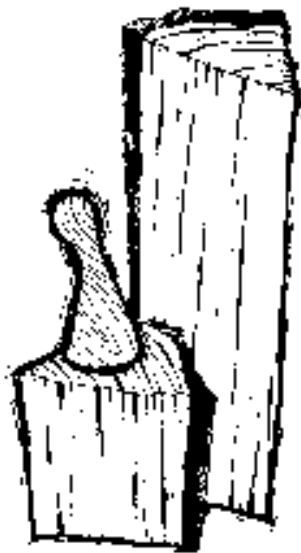
Hľadanie Pravdy kresba: šomo

Tá by o. i. mala rešpektovať základné princípy integrovaného rozvoja vidieka, skĺbiť možnosti ponúkané spoločnou poľnohospodárskou politikou EÚ a európskymi štrukturálnymi fondmi. Záverečné vyhlásenie tiež zdôrazňuje potrebu zachovania princípov programu LEADER a vyzýva európske krajiny, aby všetky ostatné politiky (dopravná, školská a i.) rešpektovali skutočnosť, že na vidieku žije až polovica Európanov.