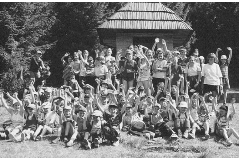
Aj jednoduchý turistický výlet pre deti môže vyzeráť pestré a zaujímavé

„Zraz bol ráno v centre obce. Trasa viedla najprv na Jalinov vrch. Tam, keďže bola dobrá viditeľnosť, členovia Turist klubu naučili deti názvy okolitých vrchov a pohorí. Odtiaľ sme pokračovali na vrch Kaňov a z neho sme vystúpili na Marusov. Na vrchole sme si všetci podali ruky. Na malej čistinke čakalo deti prekvapenie – okolo vaty sedeli zbojníci a spievali. Postupne sme sa všetci k ich spevu pridali a tiež sme sa spoločne odfotili. Z Marusova sme zostúpili ku kaplnke v Rovniach. Tu už bol pripravený ohnisk, na ktorom sme si opekali slaninku a špekačky, podával sa teplý čaj. Členovia Turist klubu porozprávali svoje zážitky z turistiky a horolezectva a pripravili ukážku stavania stanu. Ďalším prekvapením pre deti boli rôzne zábavné súťaže, do ktorých sa zapojili aj dospelí. Najviac smiechu si vyslúžila disciplína Kŕmenie zbojníkov chlebom s džemom so zaviazanými očami. Na záver boli deti odmenené drobnými sladkosťami. Tejto celodennej akcie sa zúčastnilo 70 detí a 22 dospelých.“