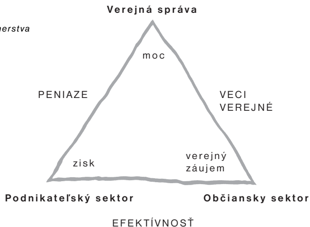
Schéma: Poslanie partnerstva