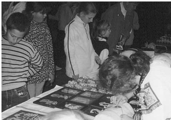
Nádherné vyšívané obrusy, čipky tých najúžasnejších tvarov, výrobky zo šúpolia, drevorezby i kresby žiakov bzovíckej školy

Akcia sa vydarila. Slovenský vidiek má naozaj neodolateľnú chuť. (Prevzaté z Hontianskych novín, krátené.)