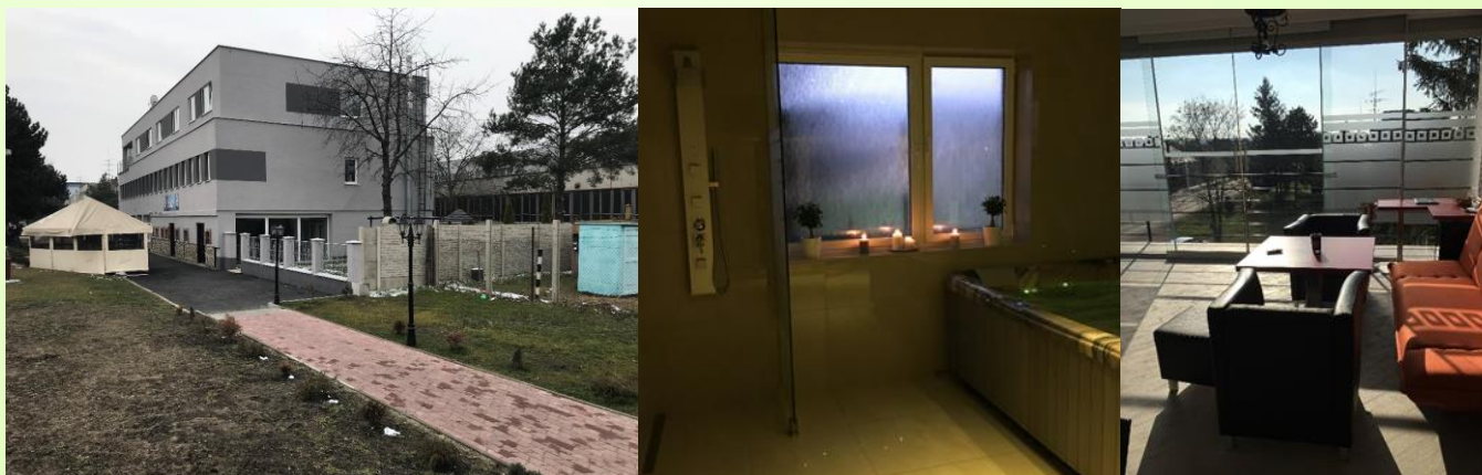
Fotografia po realizácii projektu; Zdroj: Archív Common Comity, s.r.o.

Schválená výška príspevku z PRV SR 2014 – 2020: 198 000,00 €