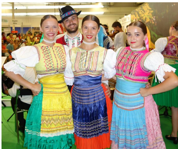
V Expozícii NSRV SR panovala počas výstavy Agrokomplex príjemná atmosféra.