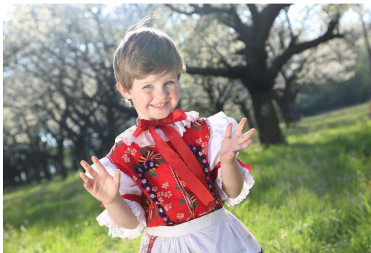
Absolútny víťaz 7. ročníka súťaže „Najkrajšia fotografia z územia MAS/VSP“ s počtom "lajkov" 383 Príspevok s názvom " Jarná radosť z Bojne " Autor: Peter Marko OZ RADOŠINKA