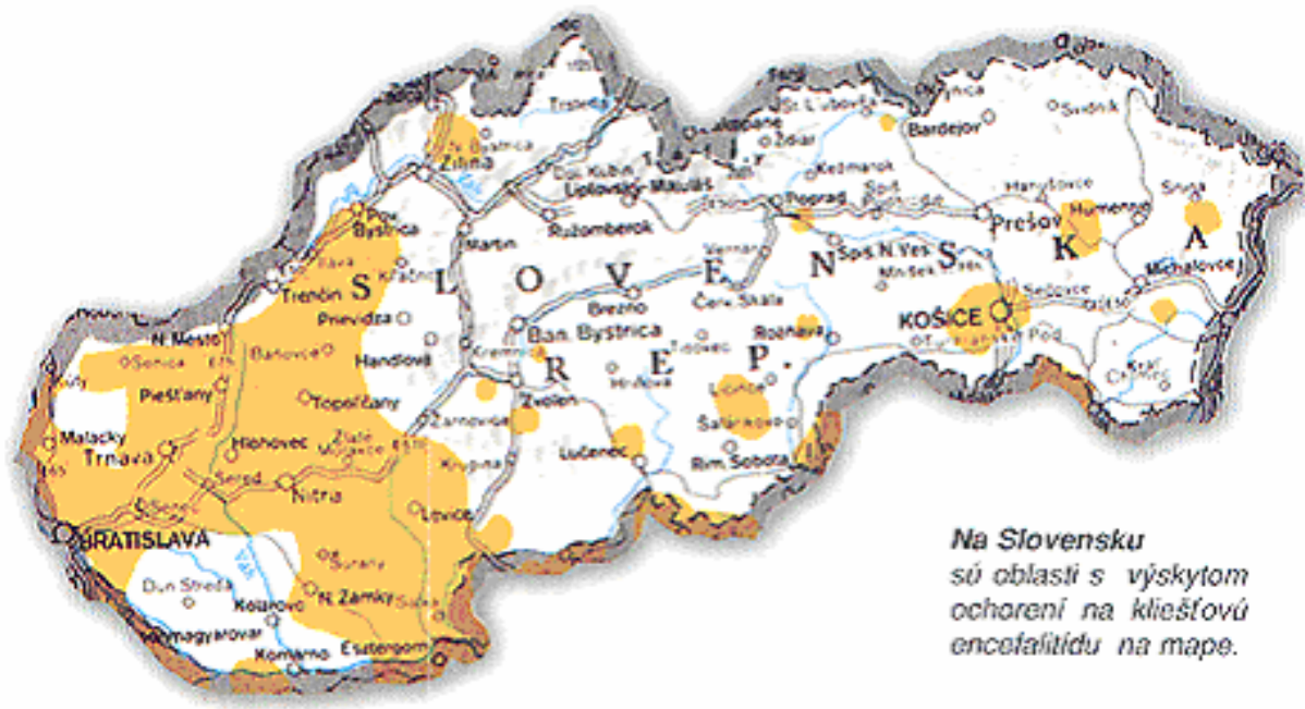
Na Slovensku sú oblasti s výskytom ochorení na kliešťovú encefalitídu na mape.