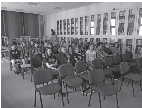
Študenti počas predstavenia projektu

Témou diskusie bolo: „ Procesy, systémy a politiky v oblasti vidieckej mládeže v regióne “