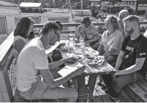
Diskusia s mladými a vypisovanie dotazníkov v Kaške .....

nými školami na území obce (ZŠ, ZUŠ, MŠ). Ďalej členovia organizácie spolupracujú s dobrovoľnými organizáciami – Slovenským zväzom zdravotne postihnutých, Jednotou dôchodcov a ostatnými neziskovými organizáciami na území obce a mikroregiónu Horehron. Je dlhoročným členom Partnerstva sociálnej inklúzie okresu Brezno, Vidieckej organizácie komunitných aktivít. Ďalej je členom Verejno-súkromného partnerstva Horehron. Členovia sa vzdelávali v programoch pre podporu a rozvoja vidieka, absolvovali školenia z oblastí komunikácie, organizovania podujatí/aktivít, foriem propagácie/, získavania zdrojov, základov písania projektov, právnych základov pre fungovanie mimovládnych neziskových organizácií, fungovania samosprávy, strategického plánovania v organizáciách a svojej komunite. Svoju činnosť orientuje na spoluprácu so všetkými vekovými kategóriami v obci ale aj v regióne Horehron. Prioritu kladie na rozvoj mladého človeka. Svojimi aktivitami podporuje jeho záujmy, rozvíja jeho schopnosti a vedomosti, ktoré napomáhajú skvalitňovanie života.