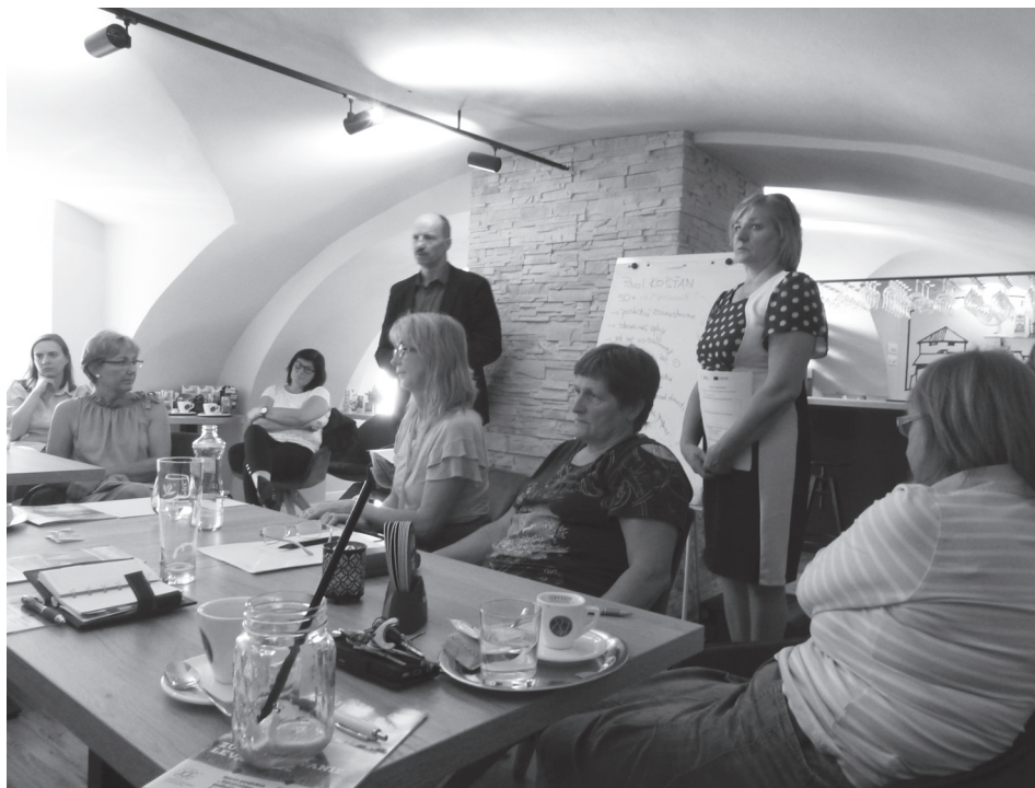
Projekt v Krupine

a iných konkurenčných výhod. Postupne aj zamestnávateľia začínajú znovu objavovať čaro skúsenosti a stability zamestnancov 50+.