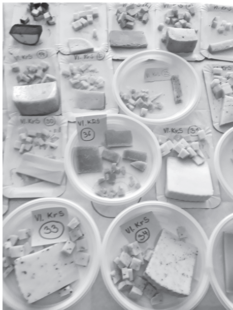
Výstava súťažných syrov

ale i zrejúce syry „Koza“ z Ekofarmy šťastná koza“ a aj mnohé ďalšie.