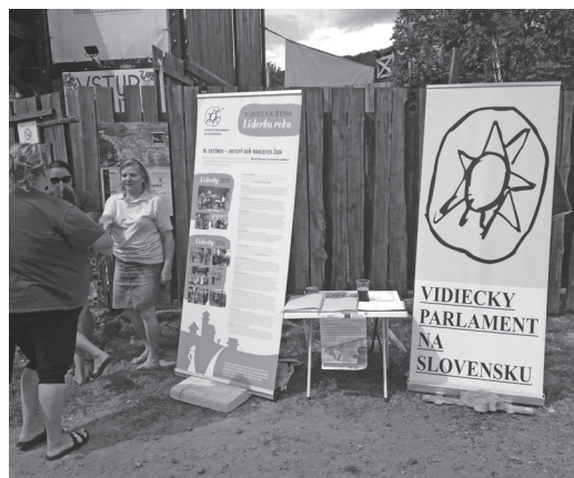
Propagácia projektu na Hontianskej paráde v Hrušove