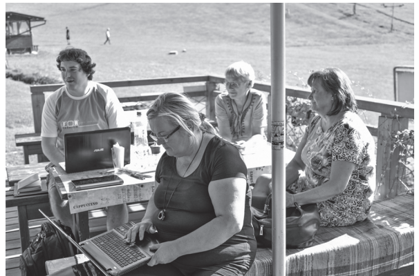
Projektový tím v Kaške .....

Poslednou zrealizovanou aktivitou bol seminár v obci Helpa 18. 9. 2018. Zúčastnilo sa na ňom okolo 60 mladých ľudí vo veku 13 – 14 rokov z krajín V4 (Program Erasmus). Okrem prezentácie projektu a diskutovaným témam, študenti sa venovali tvorivým edukačným aktivitám (príprava projektu – žiadosti o grant na tému Spolupráca mládeže na vidieku a modelovej situácii „Budovanie infraštruktúry v obci“.