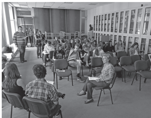
Diskusia mladých s odborníkom