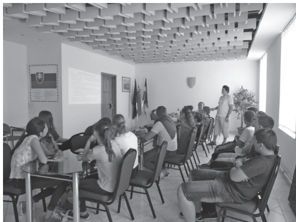
Prezentácia na Obecnom úrade v Helpe

V rámci workshopu sa predstavila miestna organizácia Dedinská únia helpianskyh aktivistov o. z. Spolupracujú s miestnou samosprávou, základnými školami na území obce (ZŠ, ZUŠ, MŠ). Ďalej členovia organizácie spolupracujú s dobrovoľnými organizáciami – Slovenským zväzom zdravotne postihnutých, Jednotou dôchodcov a ostatnými neziskovými organizáciami na území obce a mikroregiónu Horehron. Je dlhoročným členom Partnerstva sociálnej inklúzie okresu Brezno, Vidieckej organizácie komunitných aktivít. Ďalej