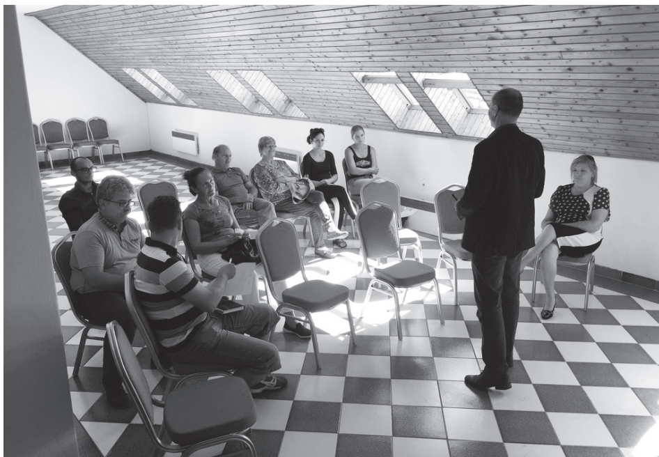
Projekt v Bzovíku

Ľudia po 50-tke majú skutočne veľa skúseností