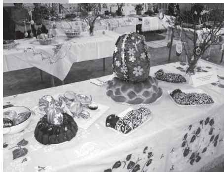
Výstava súťažných kraslíc a veľkonočných zvykov