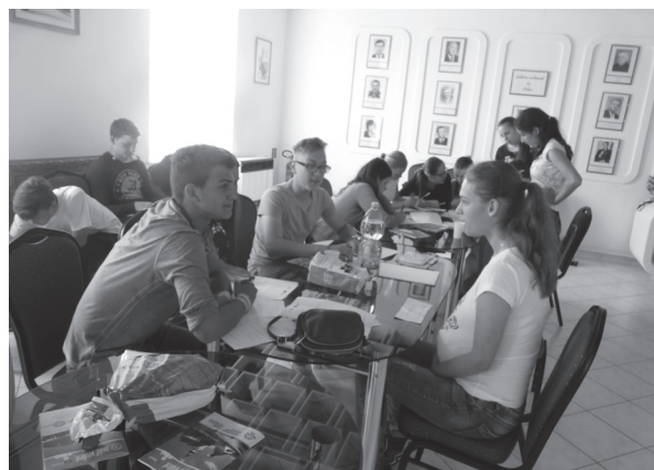
Študenti sa pokúšali pri prípadových štúdiách vžiť do role diskriminujúcich aj diskriminovaných.

Následne sme nechali priestor na diskusiu a otázky účastníkov.