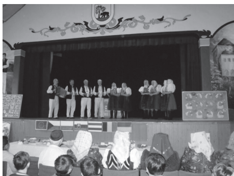
Výstavu otvorili piesňami súbory z Jakloviec a Kojšova kde žije aj Rusínska menšina.

religiózne prvky zdobiace obydlia. Vyšívané obrusy, kríže, bahniatka a zlatý dážď vo vázach, koláče (paschy), baránkov, medovníkové vajíčka, prútené košíky ,slamené zajace. Zároveň vystavovali svoje výtvarné práce deti zo Základnej školy v Jaklovciach a Materskej školy v Jaklovciach.