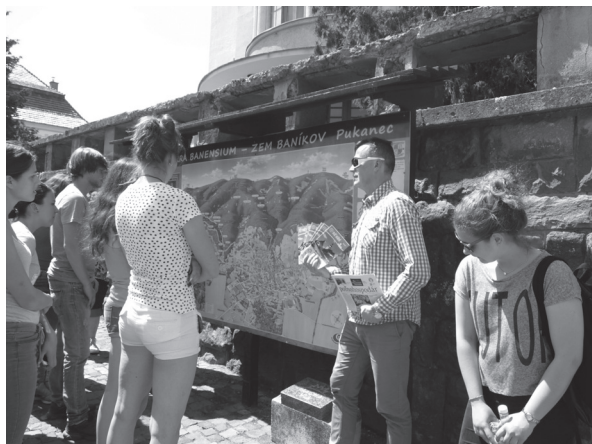
Návšteva bývalého banského mesta Pukanec

Po schválení žiadosti o predĺženie sme pokračovali do konca júna. Pomohli sme mladým NEET zorientovať sa v legislatíve, marketingu, účtovníctve, IT, v podnikaní, právne poradenstvo, napísať podnikateľské plány, pre účastníkov boli zabezpečené aj študijné exkurzie spojené s návštevou firiem a samostatne zárobkovo činnými osobami. Majitelia porozprávali o svojich začiatkoch a skúsenostiach z podnikania v zmysle štruktúry podnikateľského plánu, ktorý si účastníci vypracovávali. Časový realizačný plán, nájomné vzťahy, technické a organizačné zabezpečenie realizácie zámeru, reklama, konkurencia, marketingové ciele, finančná prognóza, predpokladané náklady a výnosy, podiel