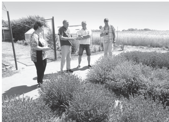
Levandulaland vo Veľkých Levároch