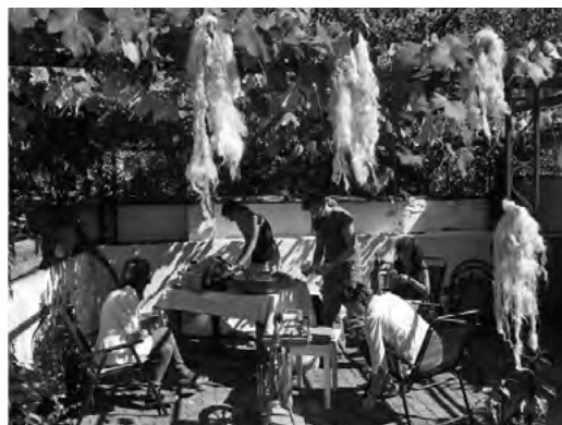
Pri spoločnej práci

stupne prispôbil súčasným nevypočítateľným podmienkam na trhu a Farmu Roziak môžeme prezentovať ako príklad dobrej praxe. Súdržnosť v rodine a v miestnej komunite vytvárajú pevné základy pre podnikanie. Atmosféra miesta, ktorú tvoria myšlienky previazané na predkov je akosi „neviditeľnou ochranou“. To je v súčasnej dobe nesmierne dôležité, lebo podnikatelia často čelia nezmyselným byrokratickým nariadeniam a ťažko predvídateľnej situácii na trhu. Práve pocit zázemia a stability im umožňuje ľahšie prekonávať tieto prekážky.