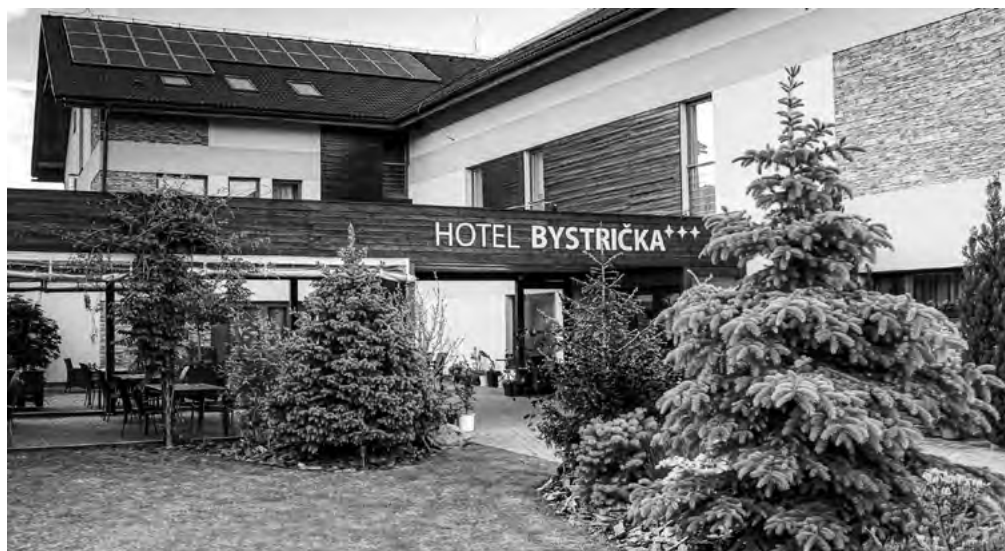
Hotel Bystrička po rekonštrukcii v duchu modernej architektúry

piva si prídu na svoje pri degustácii slovenských remeselných pív. Súčasná podoba hotela Bystrička je výsledkom rekonštrukcii v roku 2009. Moderná architektúra, pekne upravené okolie hotela, možnosť príjemného posedenia na letnej terase s jazierkom, výborná hotelová reštaurácia Paté, dobre vyškolený, profesionálny tím pracovníkov hotela – to všetko prispieva k spokojnosti hostí jeho hostí.. Nechýba ani dobre vybavený wellness s jacuzzi a saunou. Pre návštevníkov Martina je ubytovanie v hoteli Bystrička nielen príjemným miestom na pobyt, ale aj atraktívnym prostredím, v ktorom sa spája minulosť so súčasnosťou a vhodným východiskovým bodom na spoznanie jeho okolia.