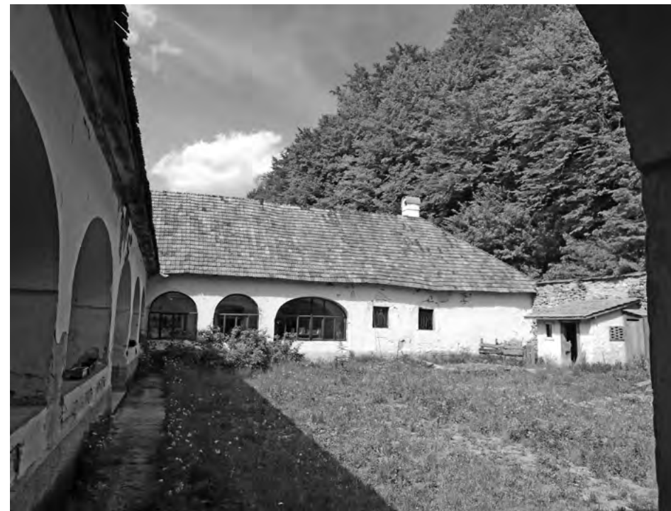
Budova pošty zaujala aj filmárov, točil sa tu film Kristián

zie, do Banskej Štiavnice v r. 1764 Štamposkou dolinou prešli aj ďalší dôležití návštevníci Banskej Štiavnice. Dialo sa tak aj v čase, keď už stála nová budova pošty rodiny Gallovičovej. 27. júla 1798 tadiaľto prešiel palatín Jozef. O pol jednastej predpoludním ho pri Štampochu privítal hlavný komorský gróf a banský radcovia. V roku 1802 prešli dolinou princovia Anton a Rainer. Po krátkej noci strávenej v Banskej Štiavnici, už o pol ôsmej ráno odišli so svojím sprievodom. Predsta-