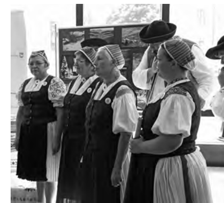
Obec Papradno – Dedinu roka 2019 reprezentovala Folklórna skupina Podžiarčan