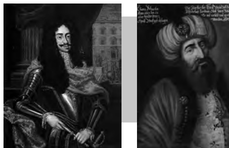
Cisár Leopold I. (vľavo) a hlavný veliteľ osmanskej armády veľkovezir Kara Mustafa (vpravo)

12.septembta 2020 uplynulo 337 rokov od bitky o Viedeň pri Kahlenbergu, ktorá rozhodla o osude Európy. Oslobodzovacej armáde, ktorá pomohla obliehanej Viedni velili poľský kráľ Ján III. Sobieski (1629 – 1696) a vojvoda Karol Lotrinský. Cisár Leopold I.Habsburský s dvoranmi Viedeň opustili a Viedeň bola preplnená a zaplavená utečencami z viedenských predmestí.