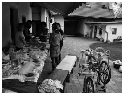
Na farme u Roziakovcov

OZ VIPA SK od roku 2019 pracuje v medzinárodnom konzorciu projektu H2020 PoliRural ( https://polirural.eu ). Premena vidieckej politiky spočíva v šírení nových poznatkov a vo vytváraní nových postupov, tak aby sa neopakovali chyby z minulosti. Hlavným výstupom projektu je digitálna inovačná platforma, kde zainteresované strany budú zdieľať svoje potreby a úspechy s cieľom zlepšiť vidiecku politiku a rozhodovanie na miestnej, regionálnej a vnútroštátnej úrovni. OZ VIPA SK pripravuje pre projekt PoliRural príklady dobrej praxe podnikateľskej činnosti na vidieku, ktoré budú dostupné prostredníctvom podnikateľského inkubátora (je aktuálne vo vývoji a dostupný na linke: https://hub.polirural.eu/best-practises ).