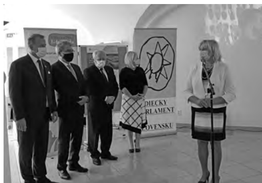
Príhovor predsedu NR SR Borisa Kollára

Vážené pani poslankyne, vážení páni poslanci, vážené pani predsedníčky, páni predsedovia, štatutári organizácií a priaznivci vidieka. Ako už istotne viete, téma vidieka mi je nesmierne blízka. Prakticky, od samého začiatku môjho vstupu do politiky apelujem na potravinovú sebestačnosť a potravinovú bezpečnosť štátu. V rámci výjazdov som prešiel celé Slovensko a navštívil som nejednu farmu, pestovateľov ovocia či producentov zeleniny. Musím sa priznať, že domáce produkty, ktoré som vždy dostal na ochutnávku boli tie najlepšie. Neraz som si ich nakúpil aj domov. Avšak, už vtedy sa mi dostávalo veľa podnetov na nápravu, prípadne som sa dozvedel aj o mnohých nedostatkoch... Nakoľko