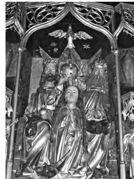
Interiér katolíckeho kostola v Pukaneci