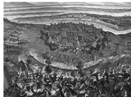
Obliehanie Viedne na dobovej maľbe

Osmanom sa podarilo zhromaždiť obrovskú armádu aj dostatok zbraní. Podľa odhadov dosahovalo vojsko, ktoré prišlo k Viedni, počet takmer 200 000 mužov. Vlastnú osmanskú armádu z toho