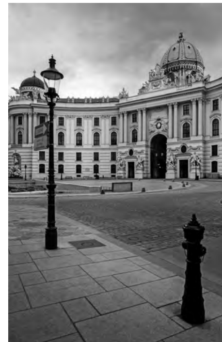
Pohľad na hlavný vstup do Hofburgu vo Viedni: Michalský trakt od Michalského námestia

Najobľúbenejšou atrakciou v paláci nie sú komnaty bývalých panovníkov, ale múzeum, ktoré je ve-