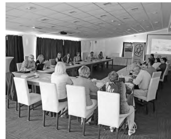
Účastníci diskusie v Bystričke

Ženy – vdovy a osamelé matky na vidieku – vylúčené skupiny (excluded groups) – vyšlo zo SWOT analýzy.