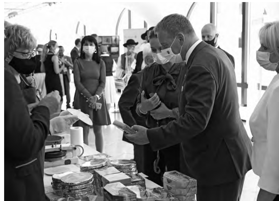
Predseda NR SR Boris Kollár si so záujmom prezrel prezentačné stánky vidieckych výrobcov

ním a zvýhodnením mladej generácie pre prácu v poľnohospodárstve a s aktívnou propagáciou poľnohospodárstva. Všade v zahraničí predsa platí, že vidiek bez poľnohospodárstva nie je vidiek. Všetci a na našom území naši predkovia dlhé stáročia predsa žili prevažne z poľnohospodárskej výroby a my by sme nemali ani v súčasnosti stratiť našu potravinovú sebestačnosť. Práve v poslednom období pri rozšírenej korone kríze sa ukázalo, aké dôležité je byť sebestačný a nebyť odkázaný na dovoz základných potravín.