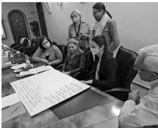
Spoločná analýza a príprava vízie