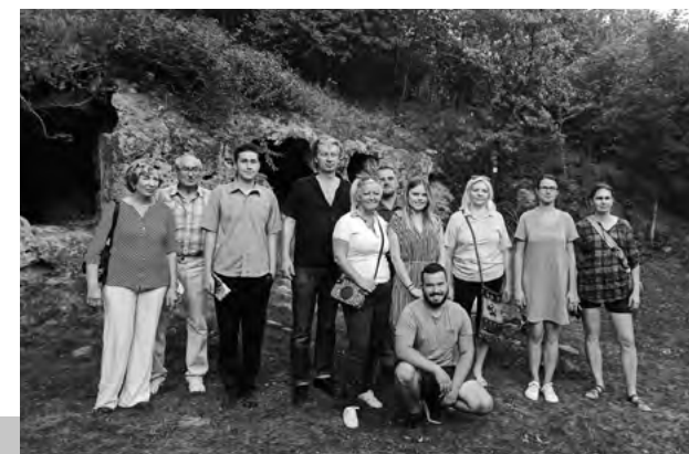
Hore: Návšteva skalných obydľí

O všetkých zážitkoch a príležitostiach sme diskutovali pri vidieckych špecialitách – plnené kozla upečené v hlinenej peci, zemiaky, domáce koláče a víno z Lišova.