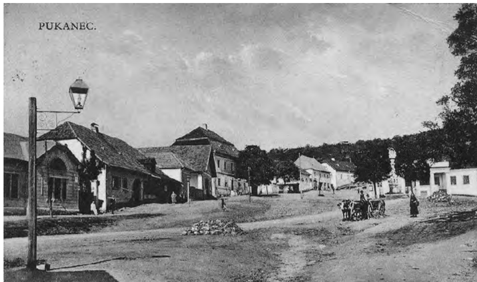
Pukanec na dobovej pohľadnici

dojeli na osamělou poštu do Steinbachu, dvě hodiny od Bátovce, začalo pršet. Mílo se nám to sedělo pod zelenou střechou košatého dubu; pošta Steinbašská leží u paty hory Hliníku, osamotě v lese. Pánové v otevřené síni kouřili, krčmář přecházel s místa na místo, okolo stavení obcházel kozel, a domácí pes Dunaj – tak zvaný vlčí, obyčejný to pes v celém Uhersku, – vida nás jist, přidrůžil se k nám. Ticho bylo vůkol, jen padání krůpějí na list a naše hlasy bylo slyšet. Přestalo pršet. Mišo seděl zase na koni, my ale šli za vozem pěšky, neboť šla silnice příkře nahoru; stoupali jsme tedy v stínu dubů a javorů, kteří se nad námi klenuli, výše a výše. Po deštičku okřálo kvítí, jež podle cest i pod stromy všude dost kvítlo, čerstvou vůni vydychujíc. Doleji viděli jsme mnoho žlutého náprstníku, výše jsme ho již nenašli. Vyjdouce na Hliník, měli jsme před sebou vyšší horu Kalnú. Mezi Kalnou a Hliníkem rozstupují se poněkud vrchy, a tu vidět až k Šahám a vrch Sandu za Ďarmoty. Slunce již se pomalu schylovalo k západu, když jsme stoupali na Kalnú; jediný doktor-úr, který co pravý Maďar nerad pěšky chodil, dokonce na vrchy, ležel na koči. Šli jsme mlčky, každý byl svými myšlenkami zaměstnán, sám v sobě se těše