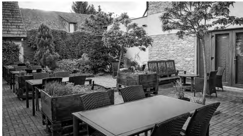
Letná terasa hotelovej reštaurácie

jedálneho lístka je z úcty k tradícii dodnes jeho obľúbené jedlo – slivkové gule. V miestnosti, kde dnes existuje reštaurácia Paté sa hrávalo ochotnícke divadlo. Mimochodom táto výborná reštaurácia sa môže pochváliť viacerými oceneniami. Podávajú sa v nej jedlá modernej i tradičnej kuchyne v špičkovej kvalite. Miestna vinotéka ponúka veľký výber slovenských i zahraničných vín, milovníci dobrého