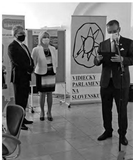
Príhovor predsedu NR SR Borisa Kollára

mi téma vidieka nie je ľahostajná, chcel som o nej diskutovať a hľadať priestor na zlepšenie. Či už sa jedná o pomoc pre začínajúcich farmárov, zníženie administratívnej záťaže, problematiky sezónnych prác či ekonomického rastu vidieka. S o to väčšou radosťou som tento rok prevzal záštitu nad Dňom vidieka v Národnej rade Slovenskej republiky, ktorý má za sebou dlhoročnú tradíciu. A tradíciám, hlavne takto podnetným, som vždy vrelo naklonený. Je mi cťou byť tu dnes spoločne s Vami. Zároveň sa teším na všetky konštruktívne rozhovory so zákonodarcami o potrebách slovenského vidieka a hľadani tých najlepších riešení, aby bola agenda vidieka atraktívnou témou. Preto mi dovoľte Vás ešte raz privítať na 17. ročníku Dňa vidieka Národnej rady Slovenskej republiky s názvom Ekonomicky rastúci vidiek, ktorý sme pripravovali v spolupráci s Výborom Národnej rady Slovenskej republiky pre pôdohospodárstvo a životné prostredie. Zároveň si dovoľujem poďakovať nie len tým, ktorí sa podieľali na organizácii tohto podujatia, ale aj všetkým, ktorí problematikou pôdohospodárstva žijú, čím obohacujú nie len nás, ale aj celú našu krajinu.