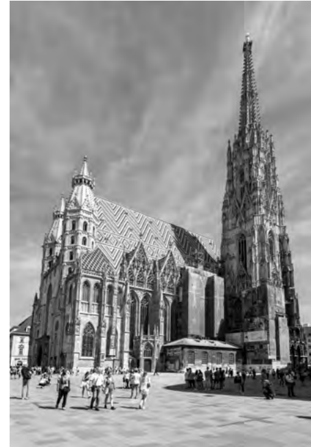
Dóm sv. Štefana vo Viedni

História stavby siaha až do roku 1147 keď na tomto mieste stál románsky kostol. Z týchto čias sa však nezachovala žiadna časť, známy je iba pôdorys stavby. Najstaršími prvkami katedrály sú na západnom priečelí Obria brána (Riesentor) a po stranách Pohanské veže (Heidentürme) z 13. storočia. Táto brána postavená v románskom slohu aj dnes slúži ako hlavný vchod do katedrály. Zbytok stavby je už v neskoršom gotickom štýle. Podľa legendy dostala názov vďaka mamutej kosti nájdennej na tomto mieste počas stavebných prác v 15. storočí. Katedrála má bohatú históriu. Stala sídelným miestom biskupa už v roku 1469 a od roku 1723 bolo viedenské biskupstvo povýšené na arcibiskupstvo. V roku 1782 sa tu ženil Wolfgang Amadeus Mozart so svojou ženou Constanze Weberovou a o pár rokov neskôr v roku 1791 sa tu konal aj jeho pohreb. Kostol prešiel za svoj dlhý život mnohými prestav-