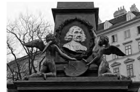
Pamätník Johanna von Liebenberg, starostu Viedne, ktorý umrel 2 dni pred víťazstvom

Zaujímavosťou je, že bitky sa ako dobrovoľník zúčastnil aj mladý, v tom čase len devätnásťročný, princ Eugen Savojský (1663 – 1736). Bola to jeho prvá bitka, ktorou začala kariéra jedného z najvýznamnejších vojvodcov na prelome 17. a 18. storočia.