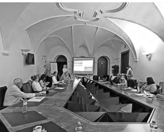
Diskusia k témam workshopu