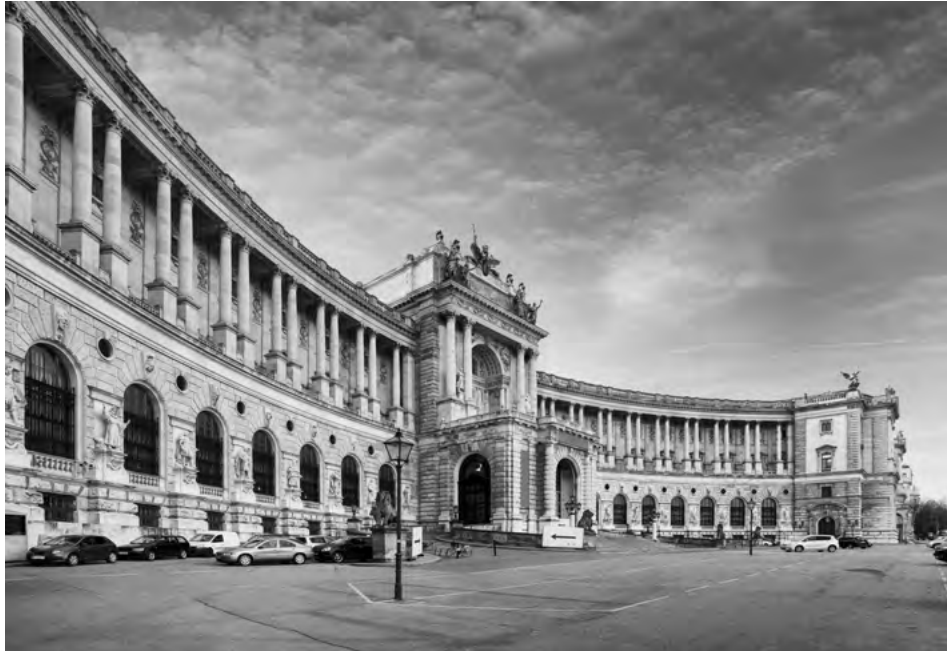
Cisársky palác v komplexe Hofburg

Najväčšou miestnosťou je obrovská hala, ktorá sa v súčasnosti využíva na organizovanie plesov. Pôvodne to malo byť miesto, kde mal sídlieť trón a kráľ tam mal prijímať oficiálne návštevy. Napriek honosným priestorom sa na to táto sála nikdy nevyužívala.