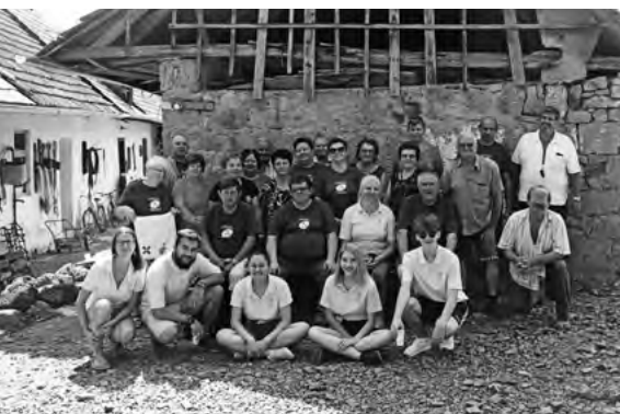
Únia slovenských organizácií v Maďarsku a členovia VIPA SK v Lišove.