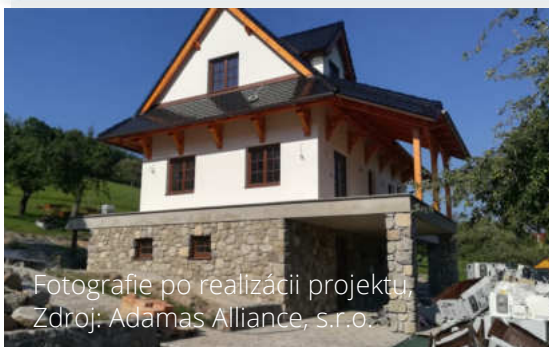
Fotografie po realizácii projektu, Zdroj: Adamas Alliance, s.r.o.

Schválená výška príspevku z PRV SR 2014 - 2020: 157 440,35 €