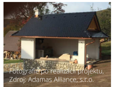
Fotografie po realizácii projektu

Jednotlivé činnosti a aktivity komplexne riešia požadovaný stav v regióne Nová Baňa.