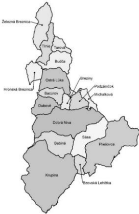
VSP Hontiansko – Dobronivské

Projekt sa realizoval v Banskobystrickom samosprávnom kraji, na území 3 miestnych akčných skupín - MAS Malohont, MAS Hontiansko – Dobronivské partnerstvo, MAS Hontiansko – Novohradské partnerstvo.