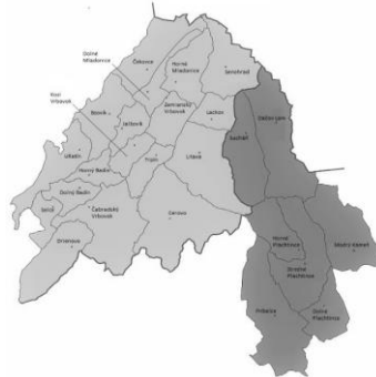
VSP Hontiansko - Novohradské