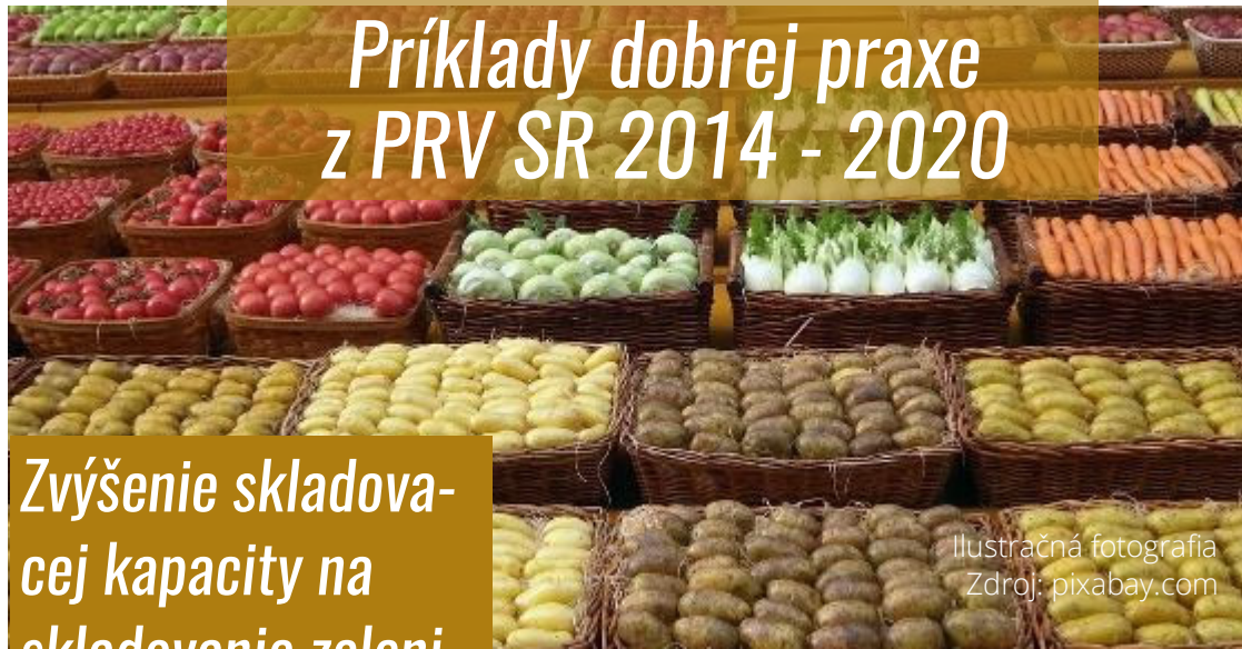
Ilustračná fotografia