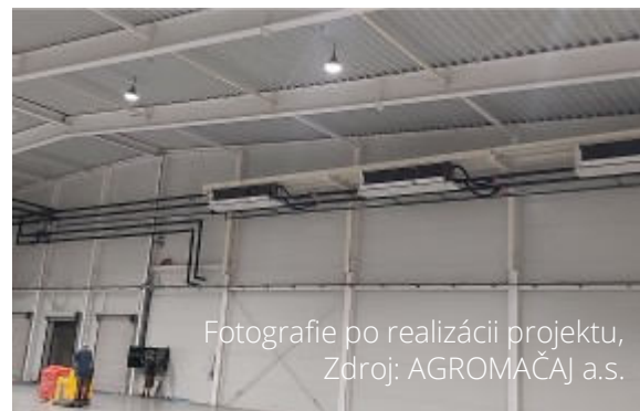
Fotografie po realizácii projektu