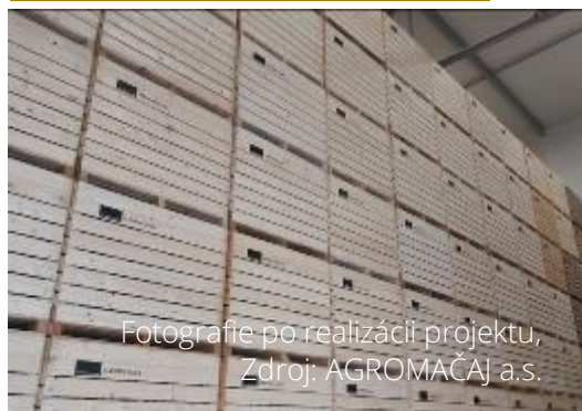
Fotografie po realizácii projektu

Realizáciou investície chce podnik zároveň eliminovať svoje slabé stránky, ktoré spočívajú v nedostatočných skladovacích kapacitách na celoročné skladovanie produkcie zeleniny a zemiakov.