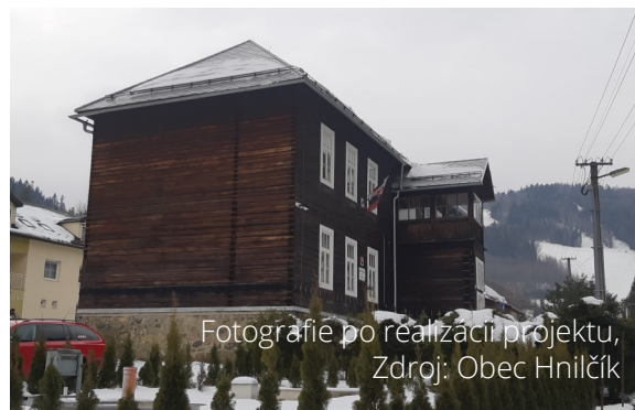
Fotografie po realizácii projektu, Zdroj: Obec Hnilčik