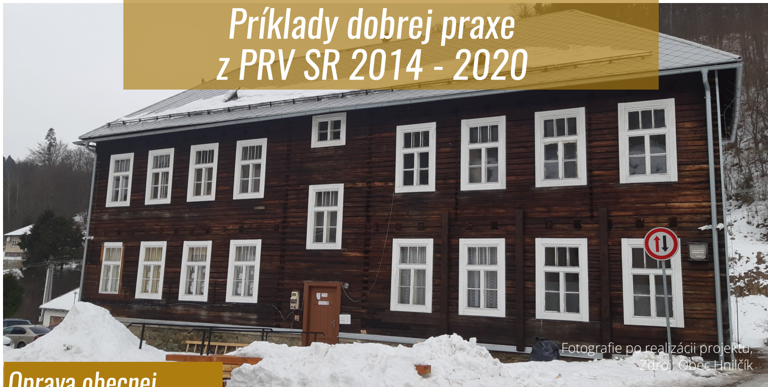
Fotografie po realizácii projektu