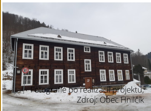
Fotografie po realizácii projektu