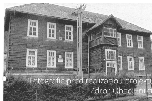
Fotografie pred realizáciou projektu

miestneho kultúrneho dedičstva odborné spracované. Zbierka vystavených artefaktov dosahuje 700 kusov. Múzejná expozícia je široko navštevovaná najmä v lete a plní funkciu miestnej aktivity, nevyhnutnej pre rozvíjanie základnej ekonomickej činnosti v obci - turistiky. Primárnym cieľom projektu bola oprava unikátnej obecnej budovy národnej kultúrnej pamiatky múzejnej expozície v Hnilčiku.