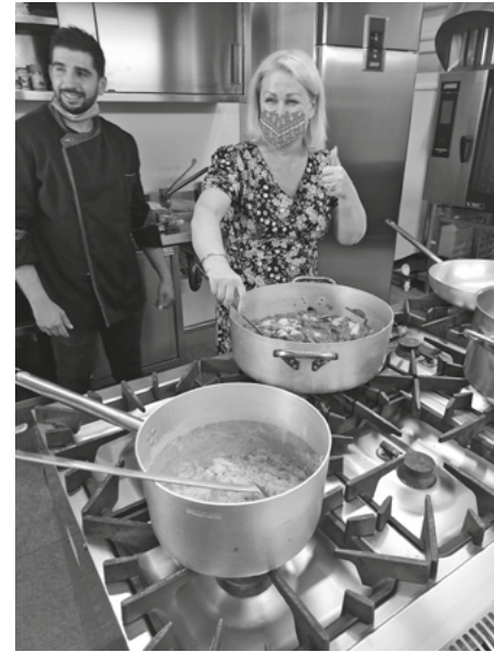
Interaktívne školenie priamo v kuchyni

nástrojov, ktoré pomôžu ľuďom z vidieckych oblastí, producentom a podnikateľom inšpirovať sa a vzdelávať v oblasti rozvoja vidieka. Celkovým cieľom tejto sady nástrojov je pomôcť miestnemu rastu agroturistickej ekonomiky, vytvorením komunity, podpory pre podnikateľov a producentov, kde sa začínajúce startupy môžu učiť, testovať, vytvárať a prosperovať.