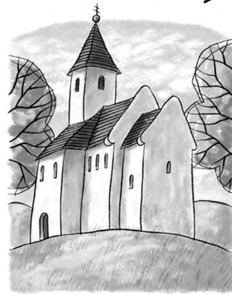
Kostol sv. Juraja v Kostolčanoch pod Tribečom, ilustrácia Pavol Borodovčák

Združenie Magna Via od svojho založenia usporiadalo veľa odborných podujatí, zážitkových podujatí v rôznych zariadeniach na trase MV, umiestnilo pamätné symbolické kamenné dlaždice s logom