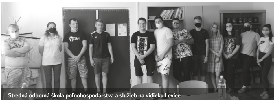
Stredná odborná škola poľnohospodárstva a služieb na vidieku Levice

Projekt #VISIONS xCHANCES je podporený z programu ACF – Slovakia, ktorý je financovaný z Finančného mechanizmu EHP 2014-2021. Správcom programu je Nadácia Ekopolis v partnerstve s Nadáciou otvorenej spoločnosti Bratislava a Karpatskou nadáciou.