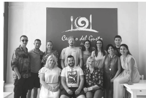
Účastníci zo Slovenska a Talianska