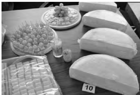
Zrejúce syry z kozieho mlieka

výrobkov natrávia mliečnu bielkovinu a uvoľňujú zdraviu prospešné bioaktívne peptidy. Fermentované mliečne výrobky obsahujú aj mnohé látky s antioxidantnými vlastnosťami a znižujú tak riziko rakovinových procesov. Konzumáciou fermentovaných výrobkov zlepšuje sa tiež imunita organizmu, zmierňujú sa alergie a zápalové ochorenia.