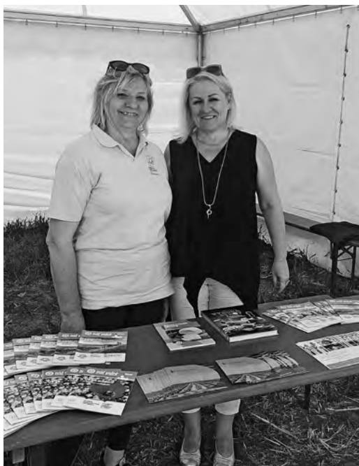
Stánok OZ VIPA SK

Výstava je prínosná predovšetkým v téme druhej rozmanitosti a pestrosti pestovaných plodín na menších plochách, ktoré sú dôležité pre zachovanie biodiverzity. Pestovatelia môžu na základe vystavených exponátov aplikovať poznatky vystavovateľov aj na svojich parcelách.