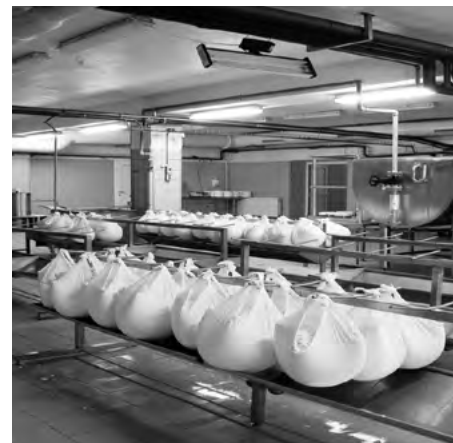
Odkvapkávanie svätky z ovčej hrudky

Mlieko a mliečne výrobky nie sú iba bežnou potravinou, obsahujú totiž veľmi dôležité látky, ktoré sú dôležité pre zdravú výživu ľudí a zvlášť detí. Predstavujú z hľadiska biologickej i energetickej hodnoty najvyrovnanejšiu a najcennejšiu potravinovú komoditu. Do budúcnosti vo svete sa preto považujú práve mliečne výrobky za podstatný zdroj potravín. Počet obyvateľov vo svete prudko narastá a sústavne sa znižujú plochy poľnohospodárskej pôdy a tým sa potraviny, vrátane mliečnych výrobkov celosvetovo stávajú strategickou surovinou. Z tohto dôvodu úlohou každého štátu by malo byť zabezpečiť ich dobrú kvalitu a dostatočnosť podľa možností z vlastných zdrojov.