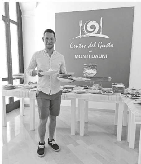
Centro del Gusto – Centrum chuti

Veľký význam vidieckych oblastí spočíva v tom, že vidiecka krajina je súčasťou nášho dedičstva a je dôležitým dôkazom na minulosť a súčasné vzťahy medzi človekom a prírodným prostredím. Nielen na Slovensku alebo vo východných krajinách, ale v celej Európe môžeme pozorovať, že vidiecke oblasti čelia poklesu významu poľnohospodárstva a odlivu obyvateľstva, preto je potrebné riešiť oživenie vidieka prostredníctvom jeho diverzifikácie. Vidiecke oblasti majú vo všeobecnosti veľký turistický potenciál, ale veľmi často im chýba stratégia a plánovanie. Napríklad regionálne jedlo a produkty môžu slúžiť na propagáciu daného vidieckeho regiónu – pre každé územie možno nájsť niektoré typické tradičné potravinové výrobky a produkty z rozmanitých surovín, miestne vína, ručne vyrábané výrobky atď. Vzhľadom na vyššie uvedené skutočnosti je cieľom projektu AGATA (ERASMUS+) vytvoriť súbor