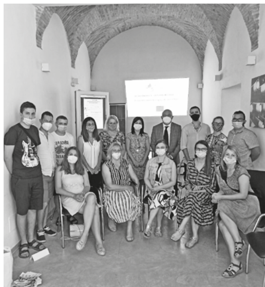
Účastníci zo Slovenska, Talianska, Poľska