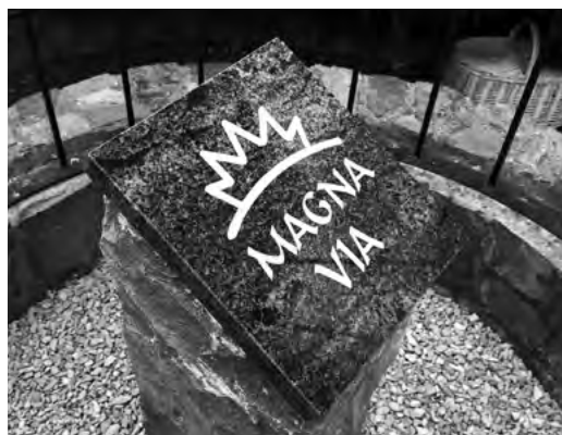
Dlaždica Magna Via v centre obce Čachtice

Súčastou kaštiela, ktorý si Nádašdyovci nechali postaviť priamo v obci, boli aj vinne pivnice. Dnes sa môžeme už len domnievať, či sa lahodné červené víno z tejto oblasti dostalo aj na svadobný stôl Františka Nádašdyho, ktorý si v roku 1575 na panstve vo Vranove vzal za manželku Alžbetu Báthoryovú.