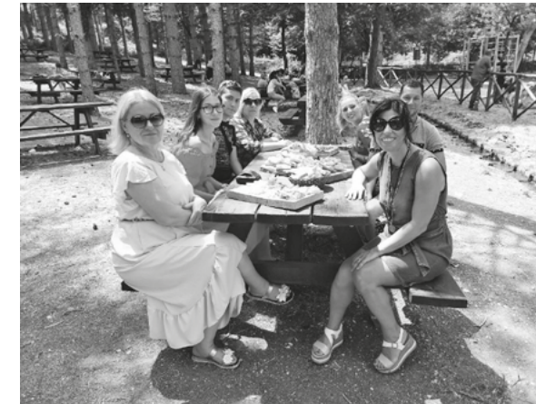
Ochutnávka miestnych produktov

Školenie bolo interaktívne a poskytlo účastníkom príležitosť vyskúšať si to, čo funguje dobre a prosperuje v regióne Apúlia v Taliansku. Aktivita prebiehala hybridne (online/off-line) a zúčastnili sa na nej ľudia zo Slovenska, Česka, Maďarska a Poľska. Účastníci krátkodobého školenia sa oboznámili sa s plánom miestneho rozvoja Monti Dauni a jeho dopadom na modernizáciu vidieckych podnikov. Očakáva sa, že účastníci projektu budú replikovať získané skúsenosti a vedomosti vo svojom vlastnom prostredí po ukončení školenia sa vypracováva akčný plán na podporu tejto akcie.