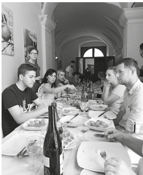
Ochutnávka miestnej talianskej kuchyne

Spomínané školenie bude východiskovým bodom pre vývoj akčných plánov, mechanizmov pre udržateľnú spoluprácu medzi zainteresovanými stranami a poskytovania integrovanej podpory pre vývoj inováčného Centra chuti v rôznych regiónoch. Účastníci aktivity boli oboznámení s myšlienkou Centro del Gusto (Centrum chuti), jej konceptom jedla ako kultúrneho prejavu a nielen ako zásobovacieho prostriedku. Táto vzdelávacia aktivita spojila lektorov z každej partnerskej organizácie, ktorí budú ďalej zdieľať svoje získane poznatky vo svojich domovských krajinách. Odborníci z Talianska predstavili, ako spojiť miestne tradície a excelenciu územia so zákazníkmi, a ponúknuť im zážitky z cestovania v zažívacom a kultúrnom prostredí tradície územia. Táto aktivita pomohla pri dosahovaní cieľov súvisiacich s osvojovaním si zručností a kompetencií pre ľudí zapojených do projektu, pretože účastníci projektu budú pripravení, spolupracovať so zainteresovanými stranami v ich regióne a vytvoriť sieť, ktorá bude schopná zvýšiť povedomie o význame identifikácie silných stránok regiónu, podpore podnikateľských aktivít v regióne a budovania vidieckych komunít.