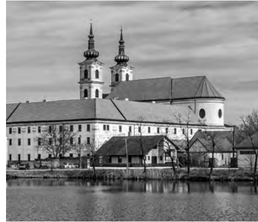
Celoslovenské pútnické miesto – Bazilika Sedembolestnej Panny Márie v Šaštine-Strážoch .....

Rozmáhajúcim sa púťami spravili prietrž reformy Márie Terézie (1767 – zákaz viacdenných púť výnimkou púť do Mariazellu, vtedy hlavného miesta púťi celej Habsburskej monarchie) a Jozefa II. (zniženie okázalosti nosením zástav, obrazov či sôch na nosítkach). Nielen zrušenie kláštorov, ale aj zbúranie niektorých pútnických stavieb bolo dôsledkom reforiem Jozefa II.