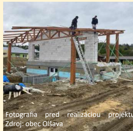
Fotografia pred realizáciou projektu

Výstavba Amfiteátra je zrealizovaná v centrálnej časti obce. V rámci výstavby sa zrealizovalo vybudovanie krytého pódia a otvoreného hľadiska pre spoločenské akcie, úprava trávnej plochy s výsadbou novej zelene, spevnené plochy zo zámkovej dlažby a výsadba listnatých drevín.