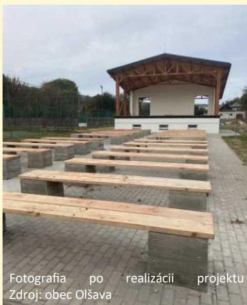
Fotografia po realizácii projektu

Schválená výška príspevku z PRV SR 2014 - 2020: 144 007,85 €