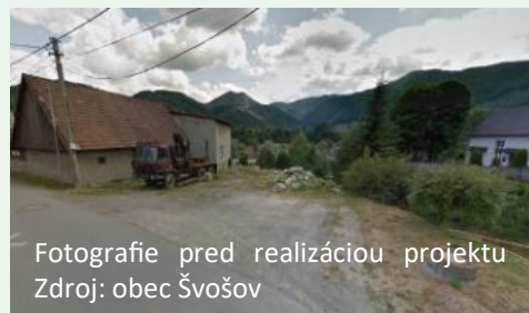
Fotografie pred realizáciou projektu