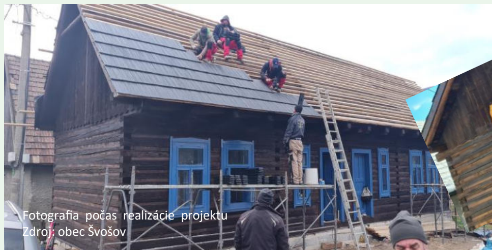
Fotografia počas realizácie projektu