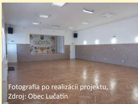
Fotografia po realizácii projektu

Schválená výška príspevku z PRV SR 2014 - 2020: 82 047,96 €