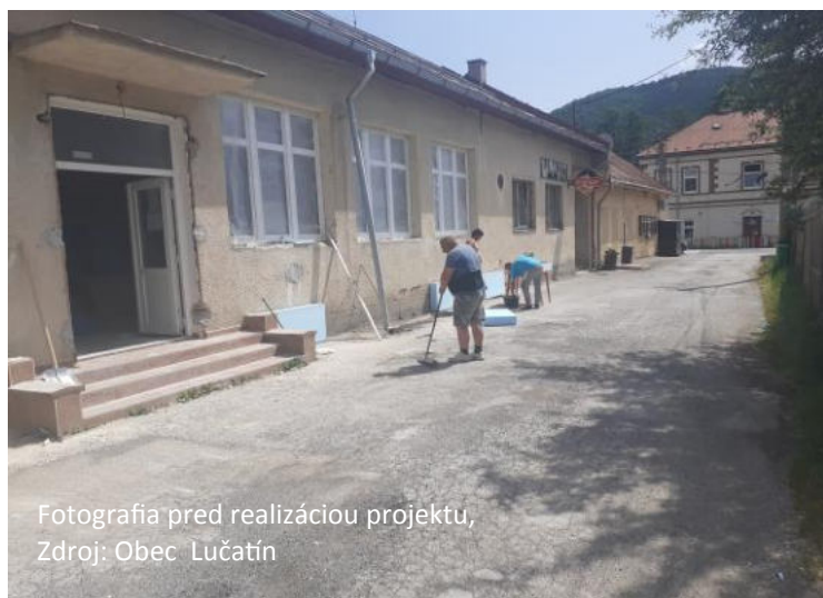
Fotografia pred realizáciou projektu