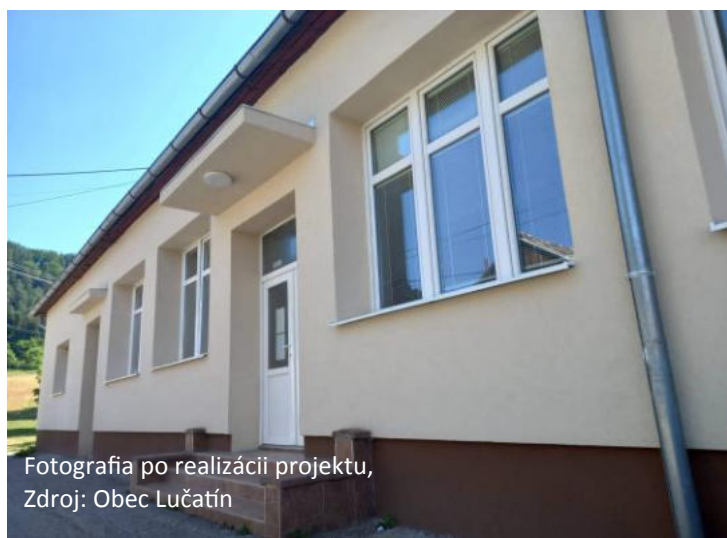
Fotografia po realizácii projektu