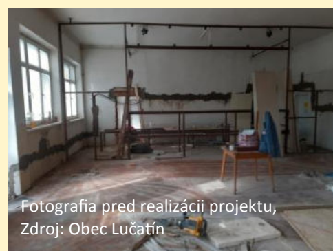
Fotografia pred realizáciou projektu, Zdroj: Obec Lučatín

Predmetom projektu bolo zrealizovanie činnosti na dosiahnutie cieľov projektu – Rekonštrukciu kultúrneho domu. Zrealizované práce v interiéri a v exteriéri prispeli k zníženiu energetickej náročnosti, zvýšeniu estetickej hodnoty, pri využívaní kultúrneho domu širokou verejnosťou na kultúrnych a športových podujatiach.