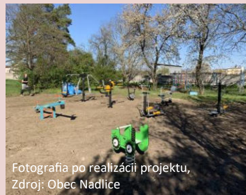
Fotografia po realizácii projektu

Predmetom projektu bola výstavba workoutového ihriska v obci Nadlice, pričom jeho realizáciou sa docielila vyššia atraktivita obce a vyššia kvalita života občanov. Táto projektová aktivita vyplývala z potrieb obce zabezpečiť vhodnú, estetickú a bezpečnú občiansku vybavenosť a kvalitnú verejnú infraštruktúru slúžiacu na oddych a zábavu a vytvoriť vhodné podmienky pre občanov na trávenie voľného času. V minulosti bola riešená plocha zarastená a nevyužívaná. Pôvodný stav predstavoval nevyužívané obecné priestranstvo ideálne pre vybudovanie fitparku s workoutovými prvkami. Predmetom projektu bolo efektívne využitie priestoru pre aktívny oddych obyvateľov v rámci obce Nadlice. Workoutové ihrisko je zostavené z jednotlivých fitness a workout prvkov a zostáv so všetkými potrebnými certifikátmi. Prvky a zostavy sú určené pre rôzne vekové kategórie. Poskytujú