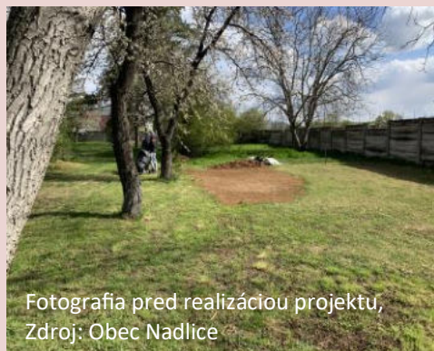
Fotografia pred realizáciou projektu

Schválená výška príspevku z PRV SR 2014 - 2020: 13 992 €