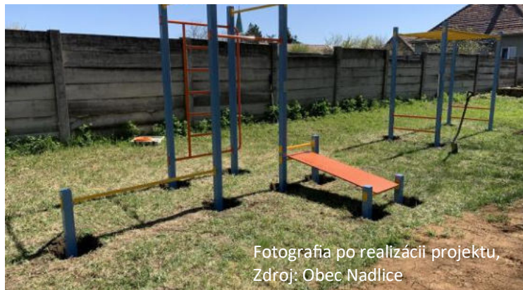
Fotografia po realizácii projektu