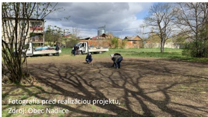
Fotografia pred realizáciou projektu

Zoznam zrealizovaných projektov z PRV SR 2014 - 2020