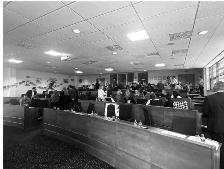
Konferencia sa konala 8. júna v Trenčíne

Snahou je pravidelne sa stretávať a diskutovať návrhy na prehĺbenie komunikácie, ako aj nájsť správny formát tvorby medzirezortného