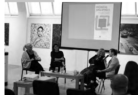
Momentky z diskusie