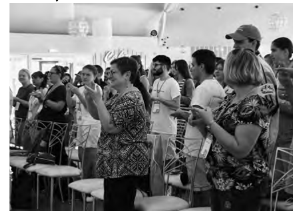
Otvorenie summitu – úvodná aktivita

Posledný tretí deň sme začali príbehmi mladých ľudí z vidieckych oblastí z Nórska, Španielska a Rumunska, ktorí sa podelili o svoju skúsenosť so životom a vyrastaním na vidieku. Veľa príbehov bolo viac smutných ako veselých, no najkrajšie na tom je, že všetci tí ľudia vždy videli nádej a išli za zmenou k lepšiemu. Dali do toho všetko, aby mohli rozbehnúť napríklad mládežnícke centrum alebo mládežnícky parlament na vidieku. Tieto príbehy nás všetkých inšpirovali k tomu, že vždy sa dá. V ďalšom vstupe nás prišli navštíviť dvaja reprezentanti Európskeho parlamentu, ktorí sa podelili o pohľady na vidiecku mládež z uhlu politikov a tvorcov politik. Sľúbili nám však, že budú robiť všetko, čo bude v ich silách, aby pretlačili naše sťažnosti a návrhy a začali ich riešiť na rozhodovacej úrovni. No a keďže všetko raz končí, tak pomaly sme sa presunuli až na záver celého summitu, kde sme zhodnotili celú akciu a dohodli sa, že toto bol len náš začiatok. Každý jeden si odniesol so sebou dávku inšpirácie, guráže a informácií, ktoré je pripravený zdieľať a odovzdávať ďalej.