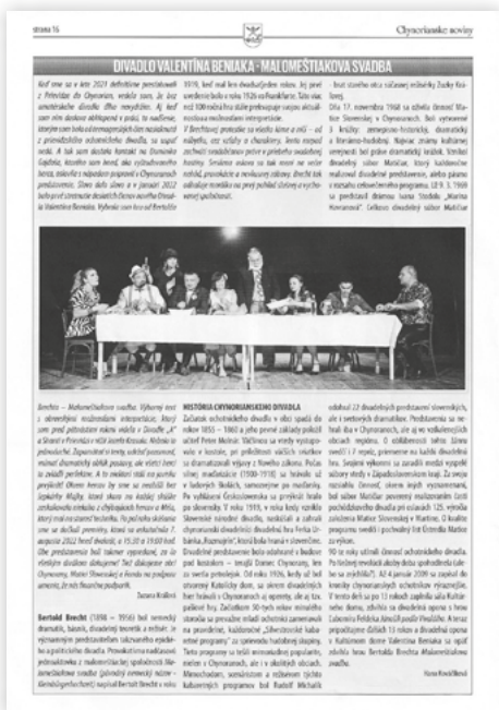
Noviny píšu o Divadle Valentína Beniaka

Na území obce sa nachádza i zvyšok najsevernejšie položeného lužného lesa na Slovensku. Chynorianský luh je štátnou prírodnou rezerváciou a vyskytujú sa tam desiatky druhov zvierat či drevín. „Chynorianský luh je známy nie tými stromami, jaseňmi, dubmi, ale najmä medvedím cesnakom,“