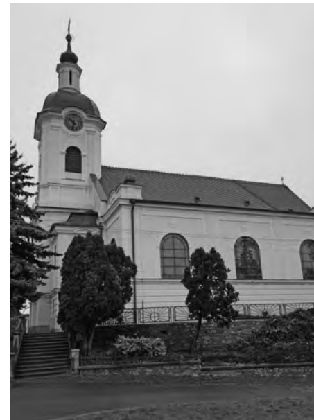
Kostol Nanebovzatia Panny Márie z roku 1789.

Na území Chynorian sa nachádzajú i historické objekty, najznámejším je podľa starostky kostol, potom sú to solné sklady. „A boli tu aj veľmi známe