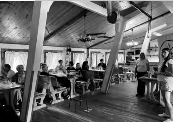
Workshopy a diskusie