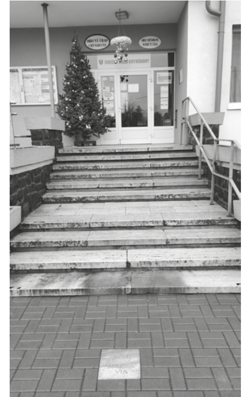
Dlaždička Magna Via pred OcÚ v Chynoranoch

Táto dychová hudba bola založená v čase silnej maďarizácie, avšak vzhľadom k tomu, že jej členovia boli Slováci, hrávali i slovenské skladby a dnes môžeme konštatovať, že aj ich pričinením národnostné povedomie rástlo. Pretože to členovia s hudbou brali poctivo a úroveň dychovky bola na tú dobu dobrá, ich pôsobenie prekročilo hranice Topoľčianskeho okresu, ba i Nitrianskej župy a v roku 1905 hrali na slávnostiach v Turčianskom sv. Martine. V roku 1906 sa vydala chynorianska dychovka i za hranice vlasti a dva týždne putovali na vozoch do Rakúska, kde hrali v meste Mariazell