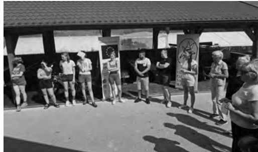
Exkurzia v areáli rodinnej farmy Uhliská

Na tomto podujatí sa OZ VIPA SK podelilo a predstavilo súbor nástrojov (toolkit), prípadových štúdií, pedagogickú stratégiu, e-learning a hodnotiaci nástroj vytvorený v rámci projektu Youth Action for Nature and Well-being.