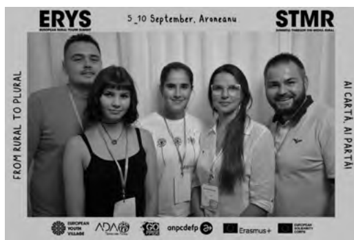
Delegácia zo Slovenska

Na začiatok sme dorazili na prvú lokalitu, kde sme sa krátko zoznámili a dozvedeli sa,