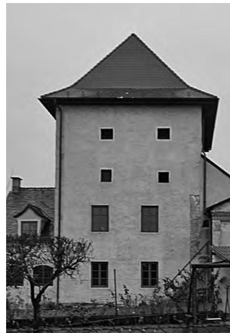
Bývalá gotická strážna veža

Začiatok 15. storočia bol už v znamení husitskej revolúcie v susednom Českom kráľovstve. Aj šľachtici mali bojovať proti husitom a keďže sa im nechcelo, dezertovali a tým sa dostali do nemilosti kráľa Žigmunda. Týmto sa dostali do služieb vyššej