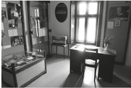
Pamätná izba Valentína Beniaka v Chynorianskom etnografickom múzeu