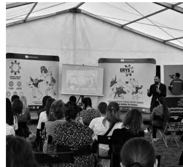
Prednáška vo vonkajšom stane

Na záver chceme povedať, že sme veľmi vďační, že sme sa mohli zúčastniť tejto inšpirujúcej akcie a veríme, že sme aj týmto krátkym odkazom oslovili Vás, milí čitatelia, aby ste sa na vidieku a vidiecku mládež pozerali ako na príležitosť rozvíjať naše komunity a okolia a prispievať k lepšiemu životu v našej spoločnosti.