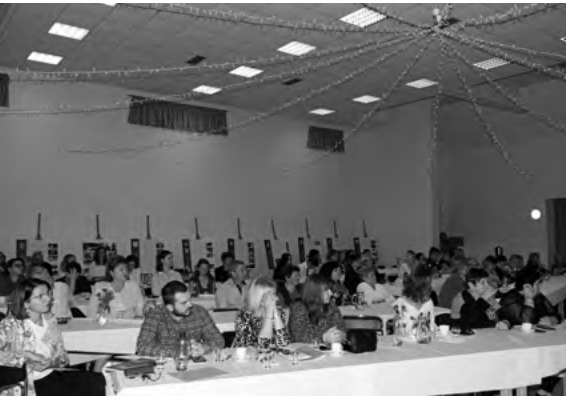
Účastníci konferencie Ženy do voza aj do koča

vorov so starším obyvateľstvom. Taktiež sa skladá z precízneho výberu materiálov k čo najvernejšej kópii, tak ako to bolo v minulosti. Každý kúsok, ktorý vytvorí, nesie s sebou hlboký význam a spojenie s našou kultúrou a dedičstvom. Svoj čas venuje výrobe párt, vencov či sklenených náhrdelníkov a ďalších ľudových komponentov. 3. Osvetová práca a edukácia: Záujem o tradície, štúdium etnológie a výroba komponentov ju priviedla k vytvoreniu projektu, ktorý sa venuje zachovaniu tradičných párt a vencov v 21. storočí. „Zámerom tohto projektu je pomocou moderného umenia reprezentovať a spájať kultúru, tradičné hodnoty a históriu Slovákov a atraktívnym spracovaním ich priblížiť aj súčasnej generácii. Výsledkom sú originálne o b -razy, ktoré unikátnym spôsobom spájajú foto - grafiu, facepainting a umeleckú maľbu.“ Viac o projekte na stránke: https://www.party21art.com/ S projektom precestovali nielen Slovensko, ale aj zahraničie, reprezentovali sa na významných udalostiach ako Olympijské hry v Južnej Kórei, EXPO výstava v Dubaji 2020, Fashion week v New Yorku a mnoho ďalších. Jej práca prispieva k udržaniu a oživeniu našich kultúrnych tradícií. Svojimi aktivitami podporuje uznávanie a rešpektovanie nášho kultúrneho dedičstva nielen v našej komunite, ale aj v širšom