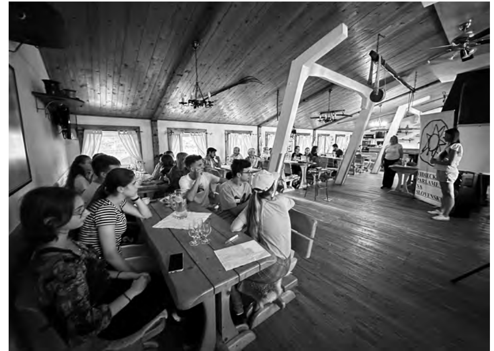
Multiplikačné podujatie v priestoroch rodinnej farmy Uhliská v Nemšovej

nám vysvetlila filozofiu trvalo udržateľného rodinného podniku. Na záver exkurzie sme si vyskúšali niekoľko aktivít na prepájanie sa s prírodou, ktoré sú súčasťou toolkitu.