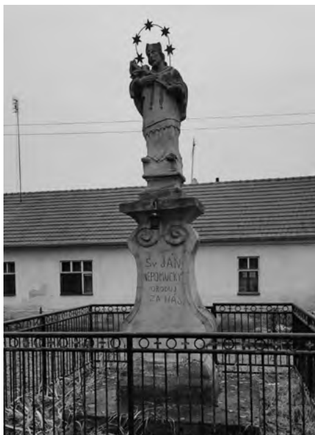
Socha sv. Jána Nepomuckého

Osvietenský panovník Mária Terézia a jej syn Jozef II. si veľmi nástojčivo uvedomili, že existujúci stav vo vzťahoch medzi poddanými a zemepánmi je nutné zreformovať a postaviť na právny základ. Poddanské povinnosti mali byť úmerné rozsahu