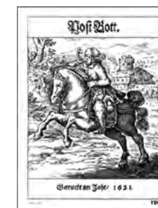
Obr. 5. Rytina poštového jazdca (z čias rozkvetu Magna Via) zobrazená na obálke prvého dňa vydania (FDC) známky „Európa 2020: Dávne poštové trasy – Magna Via“. POFIS č. 711. ....

Od kultúrneho domu v strede obce sa vyberieme po zelenej značke do hôr na východných svahoch Považského Inovca. Po ľavej strane minieme kostol Povýšenie sv. Kríža a na konci obce park so spomínaným kaštieľom. Naša nenáročná 5 kilometrová pešia túra do Krahulčích vrchov povedie do miest zaniknutej ranostredovekej osady, k národnej kultúrnej pamiatke – románskej kaplnke sv. Juraja (450 m n.m.) pod vrchom Marhát. Kaplnka, ľudovo nazývaná Jurko, sa dlho považovala za renesančnú, keďže v zázname o vysviacke (1541) nie je zmienka, že