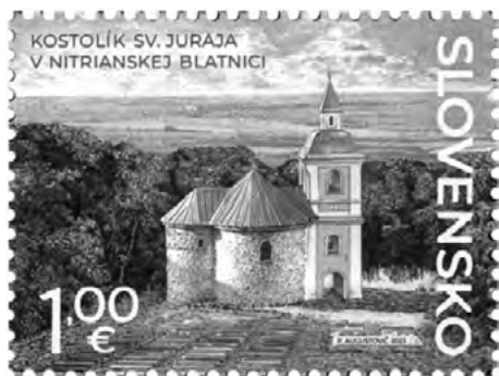
Obr. 6. Rotunda sv. Juraja pri Nitrianskej Blatnici je nie len našou najstaršou stojacou sakrálnou stavbou, ale aj v strednej Európe. Radí sa aj k najstarším pútnickým miestam na Slovensku. Predstavuje významný bod na Cyrilo-metodskej pútnickej ceste. (Rada Európy 29.4.2021 zaradila Cyrilo-Metodskú pútnickú cestu medzi certifikovanými kultúrne cesty) Známkou 40 x 30 mm spoločného vydania s Arménskom z 28.2.2023.