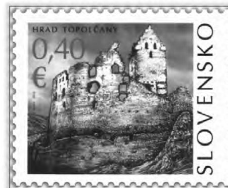
Obr. 9. Hrad Topolčany. Číslo emisie: 480 Dátum vydania: 17.09.2010. Nomin. hodnota: 0,40 € Rozmery známky: 32,5 x 27,2 mm. Technika tlače: Ofset. Náklad: 300 000