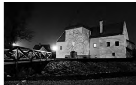
Národná kultúrna pamiatka – gotický vodný hrad v Šimonovanoch

Partizánske, kedysi označované za mesto obuvi, dnes žije dynamickým kultúrno-spoločenským životom.