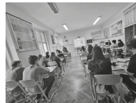
Prednáška na gymnáziu v Novej Bani

8. marca 2024 sme boli súčasťou slávnostného otvorenia 14. ročníka celoslovenskej prehliadky veľkonočných kraslíc pod názvom „Vandrovalo vajce...“ v Novej Bani. Prihovorili sme sa návštevníkom s apelom na účasť v eurovoľbách a tiež sme im predostreli našu ponuku spolupráce a aktivít.