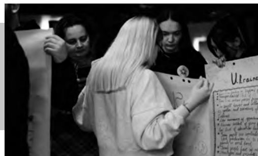
Porovnávanie výsledkov s inými krajinami