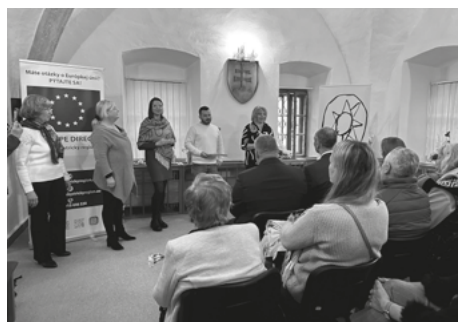
Otvorenie výstavy Vandrovalo vajce