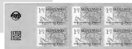
Obr. 1 – 2 – 3. Známká Magna Via (1), obálka známkového zošitka (2) a vnútro so 6 samolepiacimi známkami. Vydané 30.4.2020. POFIS č. 711. ....

odtlačky poštových pečiatok s nemeckým textom znejú „Offen“, čo v preklade znamená pec.)