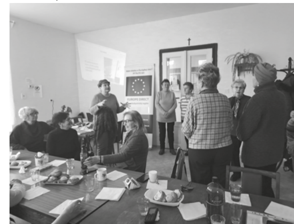
Návšteva v klube dôchodcov