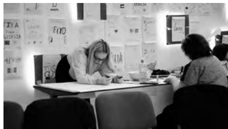
Identifikácia problémov v našej organizácii

Projekt podporuje iniciatívu zapájať mladých, ktorí bývajú vo veľmi odlahých oblastiach, do aktivít spojených s mládežou, dáva im nové možnosti