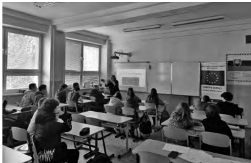
Návšteva v ZŠ E.M. Šoltésovej Krupina

Na záver by sme vám chceli dať do pozornosti oslavy 20. výročia vstupu SR do EÚ spojené so slávnostným otvorením kancelárie ED v Krupine. Bude to spoločná oslava Dňa Európy spolu so všetkými obyvateľmi Krupiny a okolia, kde sú pozvaní hostia z rôznych organizácií.