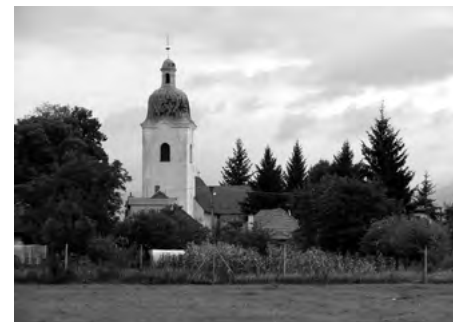
Kostol Panny Márie v Šimonovanoch

PARTIZÁNSKE (195 m n. m., 20 871 obyv.) Partizánske (do roku 1948 Šimonovany, 1948 – 1949: Baťovany) okresné mesto ležiace na juhu Trenčianskeho kraja. Šimonovany – historická časť mesta, pôvodne samostatná obec.