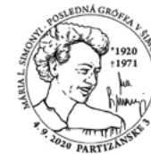
Obr 13a,b,c Krásy našej vlasti: Kaštieľ Vodný hrad v Šimonovanoch. Známk a súvisiace pečiatky. Číslo emisie 720 Dátum vydania: 04.09.2020 Rozmery známky: 44,4 x 27,2 mm Technika tlače: Ocelotlač z plochej platne v kombinácii s ofsetom. Náklad: 240 000