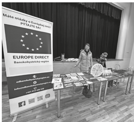
Burza mincí v dedinke Ladzany

Krupinčania sa v utorok 13.2. lúčili s obdobím zábav fašiangovým sprievodom po meste oblečení do veselých kostýmov. A naše ED Banskobystrický región bol pri tom. Na našom stanovisku si deti, ale