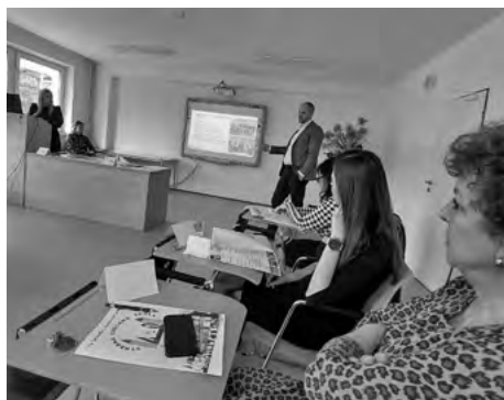
Pracovný workshop v SOŠ v Pruskom

Za posledné roky sme na Slovensku zaznamenali neustály pokles v rozvoji poľnohospodárstva a to zvlášť v živočíšnej výrobe a následne i samotného potravinárstva. Neustále sa znižujú počty hospodárskych zvierat, stále sú nedoriešené vlastnícke vzťahy samotnej poľnohospodárskej pôdy, znižuje sa vlastná potravinárska výroba a stále viac potravín sa dováža zo zahraničia. Slovensko sa stalo nesebestačné vo výrobe základných potravín. Pritom celosvetový trend a strategický cieľ každého vyspelého štátu je zabezpečiť čo najväčšiu potravinovú sebestačnosť. (U nás sme predsa boli do r. 1990 sebestační vo výrobe základných potravín). Na súčasné problémy i na naliehavé problémy viac krát v minulosti upozorňoval nadriadené orgány i náš Vidiecky parlament.