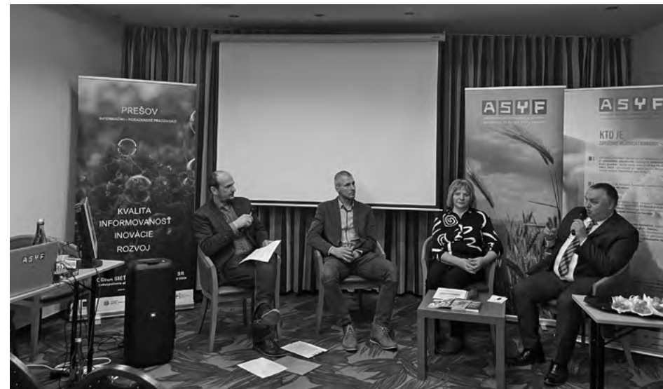
Panelová diskusia ASYF Kežmarok