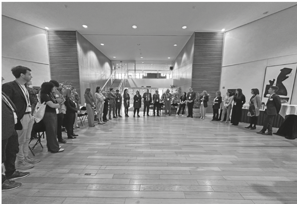
ECI team EÚ – Zástupcovia z celej EÚ spoločne

dvere k aktívnejšej účasti občanov na rozhodovacom procese a posilňuje tak demokraciu a participáciu v rámci Únie.