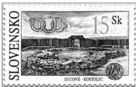
Obr. 7. Archeologická lokalita Ducové-Kostolec. Základy kostola na veľmožskom dvorci v Ducovom pri Piešťanoch predstavujú vernú kópiu základov Jurka z Nitrianskej Blatnice, ktorý stojí na opačnom – východnom úbočí. Poštová známka POFIS č. 232 vydaná 10.4.2001 nás zavedie do vnútra palisádového opevnenia a zoznamuje s tamojšími nálezmi – ženským šperkom a ozdobným gombíkom. Rozmery známky: 40 x 23 mm. Technika tlače: Rotačná ocelotlač v kombinácii s hlbkotlačou. Náklad: 174 800.