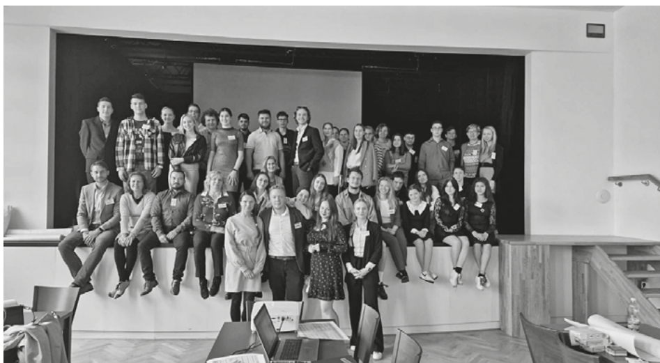
Fotografia z predchádzajúcej spolupráce

Táto iniciatíva vyzýva k zapojeniu a spolupráci, aby spoločne priniesla trvalé zlepšenia pre mladých ľudí vo vidieckych oblastiach. Najbližšia národná aktivita na Slovensku bude prebiehať počas Hontianskej vínnej cesty (21-22.6.2024), kde mladí ľudia budú pomáhať pri organizovaní tohto podujatia v spolupráci s OOCR stredné Slovensko a s obcami v regióne Hont. Tešíme sa na budúce úspechy a spoločný prínos k rozvoju európskeho vidieka.