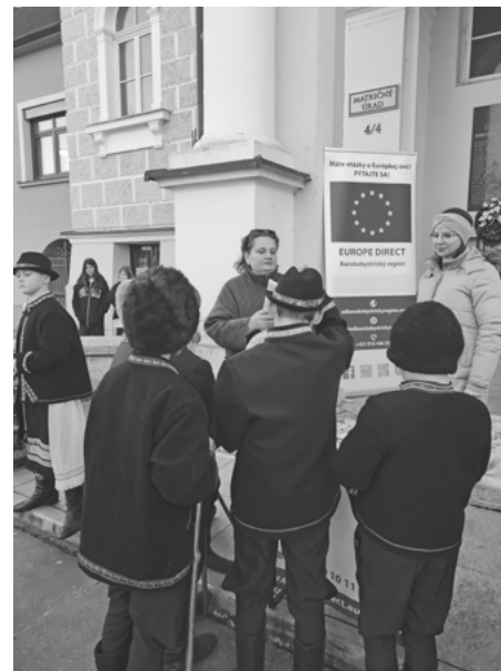
Fašiangy v meste Krupina