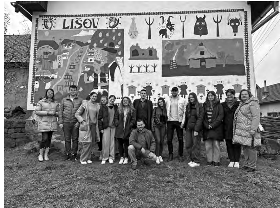
Spoločná fotografia členov Vidiecky parlament mladých na Slovensku na Lišove