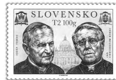
Obr. 10. Osobnosti: Ján Chryzostom Korec a Jozef Tomko. Číslo emisie: 810 Dátum vydania: 12.01.2024. Nomin. hodnota: 1,10 € Rozmery známky: 44,4 x 30,5 mm. Technika tlače: Ofset. Náklad: 120 000

Z Bojnej pokračujeme cez Nemčice (184 m n.m., 959 obyv.) 5 km do Topolčian, ktoré si pripomenie-