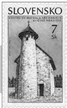
Obr. 11 a,b. Kostol sv. Michala, Klížske Hradište. Známk a pečiatka ku dňu vydania. Číslo emisie 277. Dátum vydania 15.11.2002. Nomin. hodnota: 7,00 Sk. Rozmery známky: 23 x 40 mm. Technika tlače: ocelotlač z plochých platní. Náklad: 300 000

Bošan patrí Ján Chryzostom Korec (Obr. 10). K 100. výročiu jeho narodenia Slovenská pošta vydala známku emisioného čísla 810, ktorá bola slávnostne uvedená v Bošanov 12.1.2023. J. CH. Korec vstúpil v roku 1939 do rehole jezuitov. Po likvidácii reholi a kláštorov (1950) bol internovaný a donútený odísť do civilného života. V roku 1960 bol zaistený a odsúdený ako vlastizradca na 12 rokov väzenia. V zahraničí bol známym ako „biskup v montérkach“. Zmena spoločenského systému v r. 1989 ovplyvnila a jeho život. Pápežom Jánom Pavlom II. bol 6. 2. 1990 menovaný za nitrianskeho sídelného biskupa a nitriansku diecézu spravoval do 16. 7. 2005. Dňa 28. 6. 1991 ho pápež Ján Pavol II. ustanovil za kardinála. Jeho vedecká, publikačná činnosť, osobná statočnosť, neochvejná obrana dôstojnosti človeka, slobody a identity slovenského národa, bola ocenená viacerými čestnými doktorátmi a štátnymi vyznamenaniami. Zomrel v Nitre 24. 10. 2015. Pochovaný je v Katedrále – Bazilike sv. Emeráma na nitrianskom hrade.