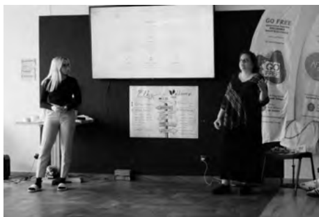
Predstavitelia VPMS predstavujú organizáciu na NGO fair

Po úspešných siedmich dňoch sa projekt ukončil, a naši zástupcovia VPMS sa vydali na cestu domov s tým, že budú môcť svoje poznatky podať ďalej v našej krajine a implementovať všetko, čo sa naučili a tešia sa na ďalšiu spoluprácu s EYV, alebo s akoukoľvek inou organizáciou, ktorú mali možnosť spoznať.