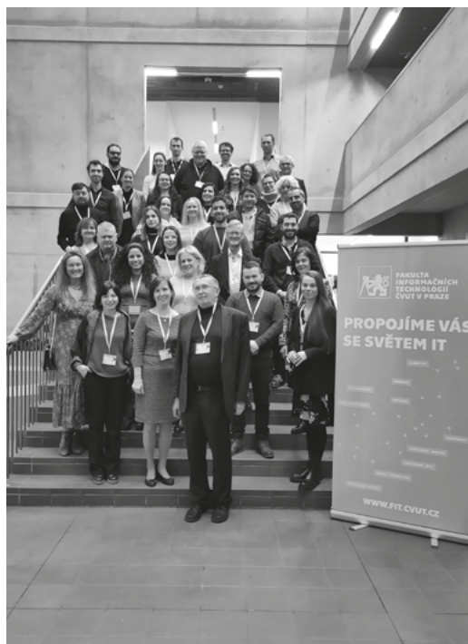
Poliruralplus team: Tím projektu PoliruralPlus

technologíí, ako sú napríklad umelá inteligencia a geografické informačné systémy. Projekt PoliruralPlus predstavuje viac než len technologickú inováciu, je to vízia udržateľnej budúcnosti, kde vidiecke oblasti Európy prosperujú v harmónii s prírodou a modernou spoločnosťou. Spolupráca medzi organizáciami, krajinami a mladými ľuďmi ukazuje cestu vpred, kde každý môže prispieť k veľkým zmenám.