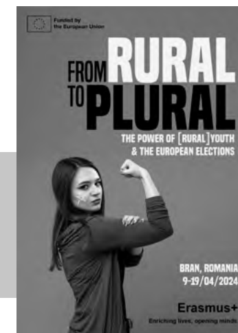
Pozvánka na mládežnícku výmenu