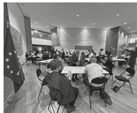
Workshop – Interaktívny workshop

Európska občianska iniciatíva je nástrojom, ktorý umožňuje občanom EÚ predkladať legislatívne návrhy priamo Európskej komisii, čo predstavuje unikátnu príležitosť na ovplyvňovanie politík na nadnárodnej úrovni. Tento mechanizmus otvára