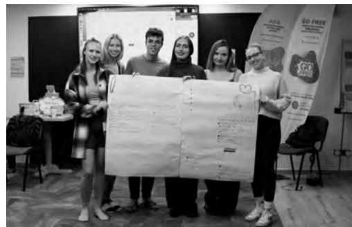
Náš projekt po odprezentovaní

v oblasti vzdelávania, profesionálneho vývoja, kultúry, rôznorodosti, dobrovoľníctva, participácie, ale aj mládežníckej politiky, rozhodovacích procesoch a spolupráce. Podporuje komunikáciu medzi mladými a vyššími inštitúciami, taktiež podporuje vznik komunit, ktoré môžu v budúcnosti fungovať na medzinárodnej úrovni, a tak upovedomiť o problematike aj ľudí z iných krajín.