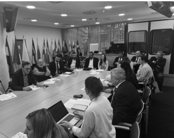
Účastníci okrúhleho stola

Účastníci diskusie sa zhodli, že vidiek je kľúčovou súčasťou Európskej únie aj Slovenska a jeho rozvoj nemožno redukovať len na poľnohospodárstvo. Práve ľudia v územiach sú nositeľmi zmien.