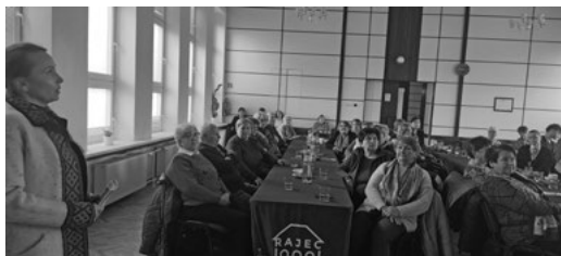
Účastníci konferencie Dedičstvo si zachovajme