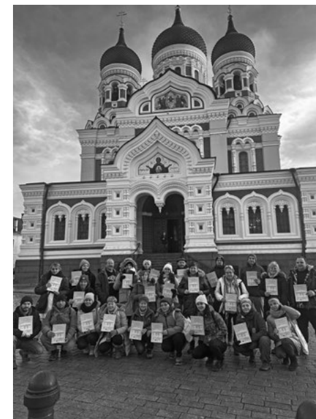
Estónsko – účastníci s certifikátmi v Taline

Jednou z prvých aktivít po získaní akreditácie bola zahraničná vzdelávacia mobilita v Španielsku, ktorá sa uskutočnila koncom septembra 2025. Pre Lišov Múzeum predstavovala dôležitý začiatok praktického naplňovania cieľov programu Erasmus+. Takéto mobility neznamenajú len odbornú cestu do zahraničia, ale predovšetkým príležitosť získavať nové poznatky, kontakty a skúsenosti, ktoré možno neskôr využiť doma – pri rozvoji kultúrnych a vzdelávacích aktivít, ochrane tradícií aj posilňovaní komunitného života na vidieku.