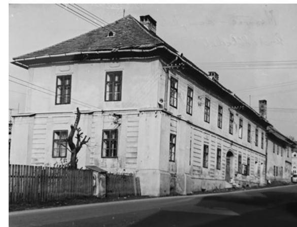
Budova tzv. malého kaštieľa.