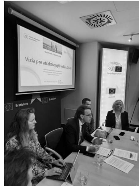
Účastníci okrúhleho stola