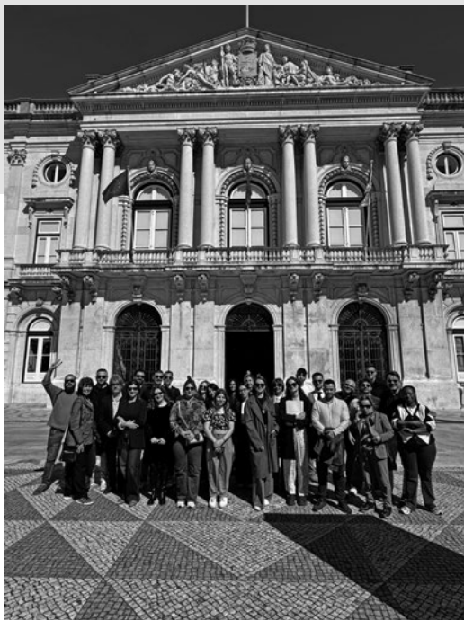
AllonBoard na námestí pred radnicou v Lisabone

čianstva a občianskej participácie. Program doplnila aj diskusia o skúsenostiach miestnej samosprávy so zapájaním obyvateľov do verejného života. Stretnutie tak nebolo len formálnym začiatkom projektu, ale aj priestorom na spoločné nastavenie hodnôt a spôsobu spolupráce, na ktorých bude AllonBoard počas nasledujúcich mesiacov stavať.