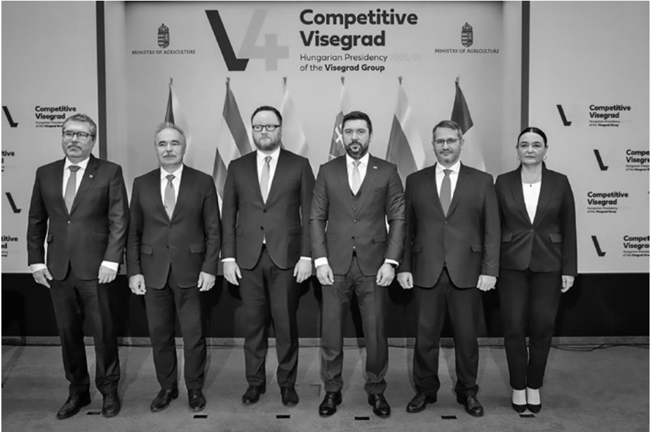
Ministri agrozozortov V4 + Bulharska a Rumunška