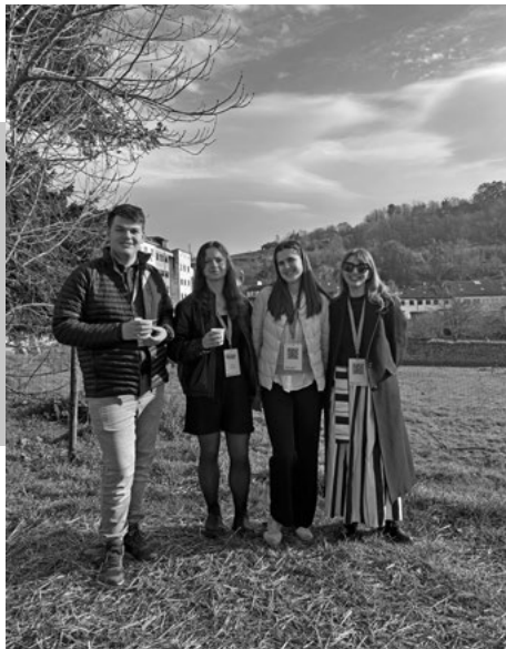
Zástupcovia VPMS a účastníčka z Česka na konferencii v Španielsku

Youth Rally 2025 v slovinskom Novom Meste, ktoré zhromaždilo približne 90 mladých ľudí z vidieckych oblastí z viac ako pätnástich krajín Európy. Témou podujatia bola participácia mládeže a jeho program ponúkol workshopy, diskusie aj výmenu skúseností