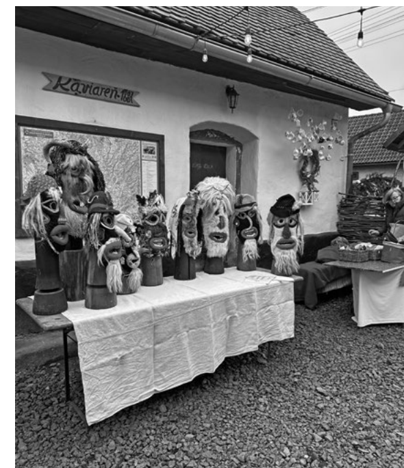
Stánok s tradičnými maskami z Rumunska

Program spojil odbornú aj komunitnú rovinu. Účastníci sa zoznamovali s miestnymi remeselnými aktivitami, navštívili workshopy zamerané na spracovanie vlny, plstenie a výrobu mydla a spoznávali kultúrne dedičstvo regiónu. Dôležitou súčasťou bola aj návšteva Zvolena a Banskej Bystrice, kde mali možnosť vidieť miestne remeselné tradície v širšom historickom kontexte.