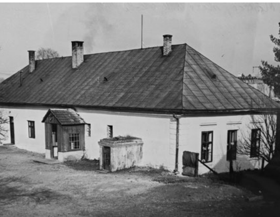
Budova historickej mošovskej školy, ktorej fundátormi boli od 16. storočia Révayovci.

prameňov zo súkromných zdrojov a umiestňovať ich na prehľadný portál, kde budú v nákladoch k dispozícii bádateľom.