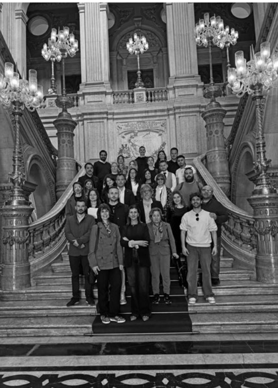
Projektový tím AllonBoard na radnici v Lisabone

čianstva a občianskej participácie. Program doplnila aj diskusia o skúsenostiach miestnej samosprávy so zapájaním obyvateľov do verejného života. Stretnutie tak nebolo len formálnym začiatkom projektu, ale aj priestorom na spoločné nastavenie hodnôt a spôsobu spolupráce, na ktorých bude AllonBoard počas nasledujúcich mesiacov stavať.