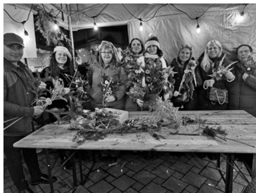
Workshop na výrobu vianočných dekorácií z prírodných materiálov v Banskej Bystrici

Záverečné hodnotenie aktivity potvrdilo, že takéto stretnutia mali význam nielen pre samotných remeselníkov, ale aj pre miestne komunity. Účastníci si odniesli nové skúsenosti, kontakty a hlbšie porozumenie kultúrnym súvislostiam remeselnej práce. Projekt CRAFT tak ukázal, že tradičné remeslá mali aj dnes svoje pevné miesto – ako súčasť identity vidieka, ako priestor pre vzdelávanie aj ako cesta k prepájaniu ľudí naprieč Európou.