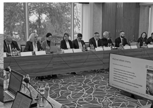
Zasadnutie RV pre MNO

D ňa 9. februára 2026 sa uskutočnil odborný okrúhly stôl „Aktualizovaná Vízia pre atraktívnejší vidiek 2040“ (ďalej len „Vízia 2040“) na pôde Zastúpenia Európskej komisie na Slovensku v Bratislave. Podujatie spoluorganizovali Slovenský vidiecky parlament, Vidiecky parlament mladých na Slovensku a Slovenská poľnohospodárska univerzita v Nitre.