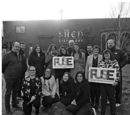
Účastníci projektu FUSE

Projekt FUSE potrvá do septembra 2028. Jeho ambíciou nie je len pomôcť jednotlivcom nájsť si prácu, ale aj ukázať, že aj na vidieku možno vytvárať zmysluplné príležitosti, ktoré prepájajú vzdelávanie, komunitu a miestnych zamestnávateľov.