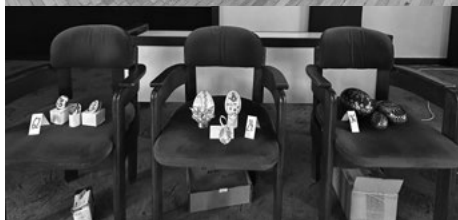
Ocenené krasličiarke a kraslice