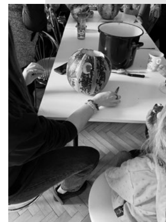
Pečenie chleba a vyrezávanie tekvic so staršími rodičmi v Uňatíne