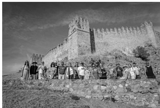
Španielsko – Účastníci na exkurzii v dedinke Santa Olalla

stvere aj estónske mliečne múzeum, kde si vyskúšali výrobu masla, zmrzliny či pečenie chleba. Dôležitou súčasťou pobytu bolo aj spoločné varenie a stretávanie s miestnymi obyvateľmi, ktoré ukázali, že jedlo, remeslo a každodenný život môžu byť prirodzeným mostom medzi kultúrami.