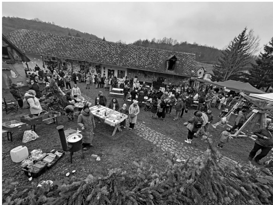
Vianočné trhy na Lišove

Osobitný význam malo zapojenie medzinárodných hostí do Lišovského vianočného jarmoku priamo v areáli múzea. Remeselníci zo zahraničia spolupracovali so slovenskými tvorcami, predstavovali tradície svojich krajín a komunikovali s návštevníkmi. Práve tu sa naplno ukázalo, že remeslo mohlo byť prirodzeným nástrojom komunitného vzdelávania, medzikultúrneho dialógu a spolupráce medzi krajinami.