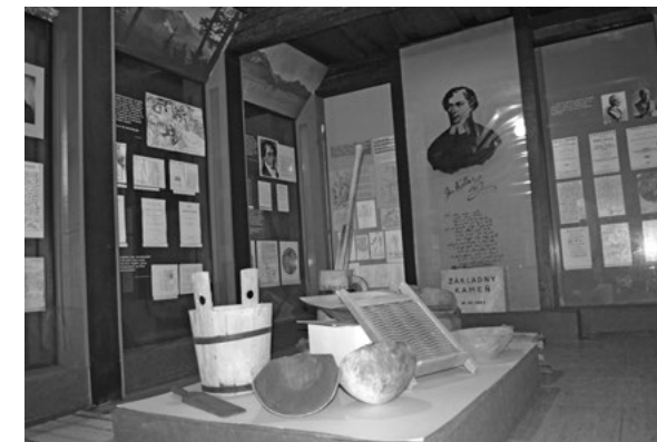
Interiér Múzea Jána Kollára v Mošovciach

Až do začiatku 90. rokov v obci pôsobila fabrika na spracovanie kožušín a nadväzný kožušinársky priemysel. Neskôr sa obyvateľstvo preorientovalo na poskytovanie služieb súvisiacich s cestovným ruchom (využívajú sa termálne pramene a okolitá