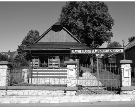
Rodný dom Jána Kollára v Mošovciach

Podľa sčítania obyvateľstva z roku k 1.1. 2023 mala obec 1361 obyvateľov, čo potvrdzuje mierny pokles populácie za posledných 7 rokov vo výške 4,7%. 98,62% z nich boli Slováci, 0,72% Česi a 0,14% Maďari. Náboženské zloženie bolo z 54,78% evanjelické, 30,36% rímskokatolícke a 12,97% obyvateľov nemalo žiadnu náboženskú príslušnosť.