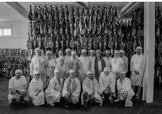
Španielsko – Účastníci na exkurzii v masokombináte na spracovanie Iberica

Estónsky program priniesol pestrú kombináciu praktického učenia, remeselných workshopov a spoznávania miestnej komunity. Účastníci sa zapojili do aktivít zameraných na prácu s drevom, kovom a ďalšími materiálmi, navštívili odbornú školu v Olu-