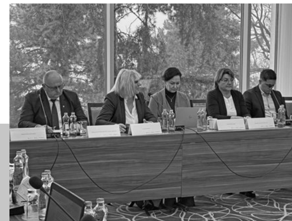
Zasadnutie RV pre MNO

Okrúhly stôl spojil viac ako 30 zástupcov ministerstiev, ústredných orgánov štátnej správy, samospráv, výskumných inštitúcií, akademickej obce, občianskej spoločnosti a podnikateľského sektora.