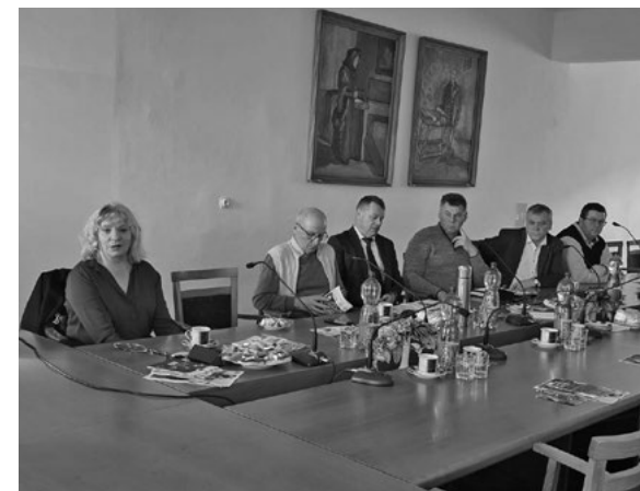
Diskusia k Vízii v Krupine

Ďalšou požiadavkou sekcie je urýchlenie vyhodnotenie výzvy na udelenie štatútu MAS a následné bezodkladné vyhlásenie výzvy na predkladanie stratégií