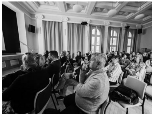
Prezentácia projektu Album turčianskych zemanov 24. marca 2026 pred zaplnenou sálou v historickom Dome advokátskej komory v Martine.

Ako výstupy plánuje stredisko nielen publikačnú činnosť, ale aj výstavy prednášky a konferencie a spolupracovať chce s poprednými pamäťovými inštitúciami.