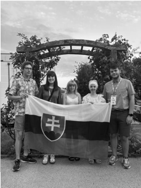
Slovenský tím v Slovinsku

Projekt Rural Youth Forward ukazuje, že o budúcnosti vidieka nemožno hovoriť bez mladých ľudí. Vidiecky parlament mladých na Slovensku sa v ňom spája s partnermi z viacerých európskych krajín, aby spoločne hľadali odpovede na výzvy, ktoré dnes vidiecke regióny najviac pocitujú – od úbytku obyvateľstva až po obmedzené možnosti vzdelávania, práce a zapojenia sa do verejného života. Cieľom projektu je posilniť vidiecke mládežnícke organizácie, podporiť medzinárodnú spoluprácu a zabezpečiť, aby hlas mládeže z vidieka zaznieval aj pri tvorbe verejných politik.