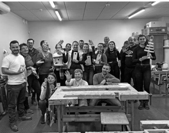
Estónsko – účastníci na workshope na prácu s drevom na SOŠ

Na prvé skúsenosti nadviazala na prelome novembra a decembra 2025 ďalšia mobilita, tentoraz v Estónsku. Vzdelávacieho pobytu v obci Pilistvere a jej okolí sa zúčastnilo 24 účastníkov zo slovenských vidieckych regiónov.